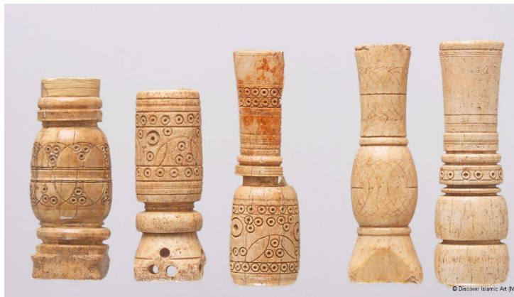
Torres de rueca, Museo de Mértola, OS/TR/003, 037, 042, 046, 057