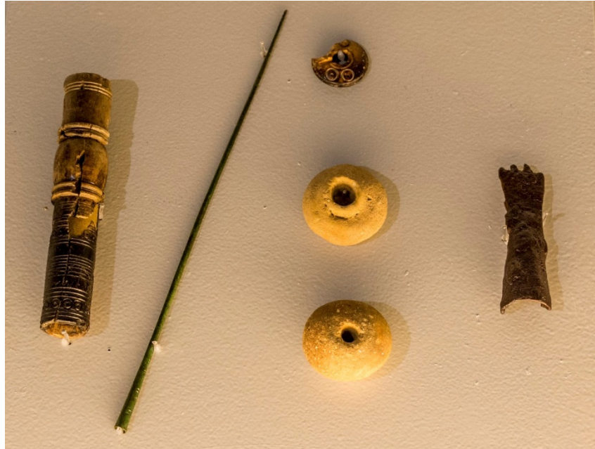
Torre de rueca, huso y fusayolas del Museo de Cáceres.

consta de dos partes: la torre y el huso que permitía recoger el hilo, mientras que en la estructura de la torre se enganchaba la lana cardada que debería ser procesada manualmente para convertirse en hilo que posteriormente se usaría en telares de tejer.