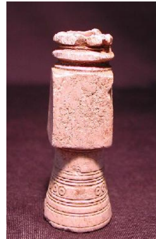
Museo Arqueológico y Etnológico de Córdoba, CE007985, interpretada como elemento lúdico.