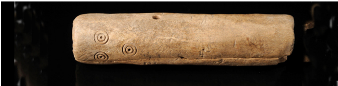
"Mango de cuchillo". Museo Arqueológico Regional de la Comunidad de Madrid, (0D2017/1/40).

Domingo: 4 de noviembre a las 12:30 horas Entrada libre hasta completar aforo