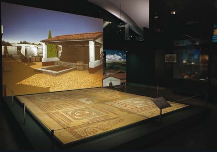
Sala de exposición. (Madrid romano)

Con la reforma se ha mejorado el discurso expositivo haciéndolo más claro y atractivo, a la vez que se han completado períodos de la prehistoria e historia madrileña que estaban poco tratados. La incorporación de nuevos yacimientos excavados en los últimos años actualiza la visión y el conocimiento de la arqueología en el territorio madrileño. El empleo de variados recursos expositivos, entre los que destacan los que utilizan las nuevas tecnologías, apoya y permite una mejor comprensión de los diferentes contenidos. Las grandes vitrinas expositoras aseguran la perfecta conservación de las colecciones y contribuyen a una buena visión de las mismas. El diseño en conjunto del proyecto se ha integrado en la propia arquitectura del edificio, en sus tres estructuras parabólicas, convirtiéndose así en el gran contenedor de las diferentes zonas. En definitiva el Museo se ha modernizado para atender las demandas de los visitantes y adaptarse al futuro.