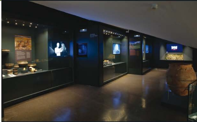
Sala de exposición. (Prehistoria reciente)