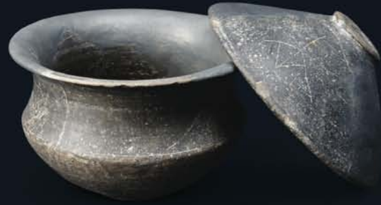
Urna con tapadera. (Edad del Hierro)