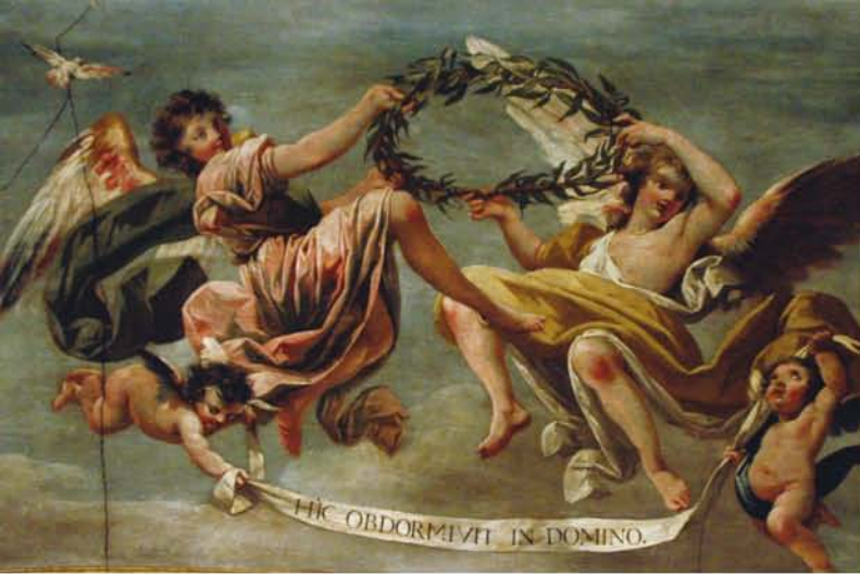
Zacarías González Velázquez. Alegoría funeraria de San Isidro (detalle), 1789

El Museo, inaugurado en el año 2000, se halla instalado en el antiguo Palacio de los Condes de Paredes, más conocido como la "Casa de San Isidro", por ser el lugar donde según la tradición vivió y murió el Santo. En el edificio de nueva construcción se conservan restos de la edificación original: un patio renacentista del siglo XVI, la capilla del siglo XVII, decorada en 1789 con pinturas al temple por Zacarías González Velázquez, y el llamado "Pozo del milagro", en el que San Isidro, según la tradición, salvó de morir ahogado a su hijo haciendo subir milagrosamente el agua hasta el brocal.