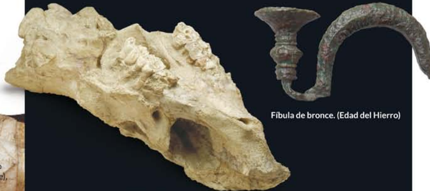
Fíbula de bronce. (Edad del Hierro)