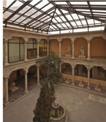
Patio renacentista, siglo XVI

Otros espacios de interés del Museo son el Jardín Arqueobotánico, con plantas documentadas en el Madrid medieval, y el Almacén Visitable, lugar en el que se exhiben numerosas y variadas piezas, cuya cronología abarca desde el Terciario hasta el siglo XX, y que permiten al público poder contemplar un mayor número de objetos de las ricas colecciones que del territorio madrileño posee. El Museo cuenta también con una sala de exposiciones temporales y un salón de actos en la primera planta.