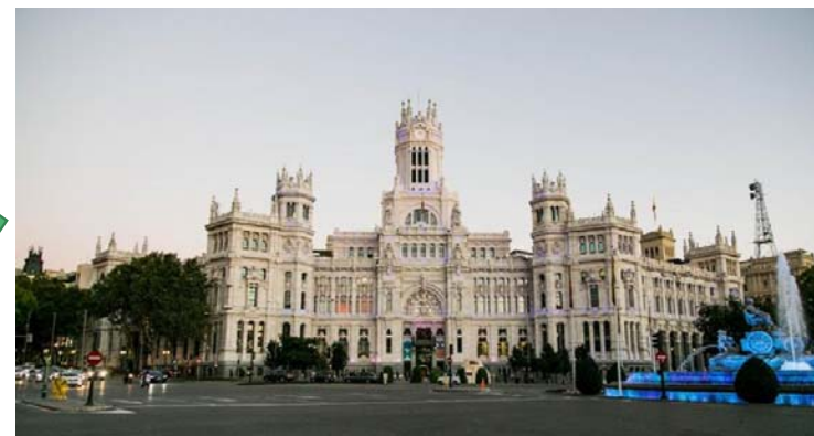
Galería de Cristal de Centro Centro Calle Montalbán, 1