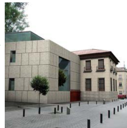
Biblioteca Municipal Iván de Vargas Calle de San Justo, 5,