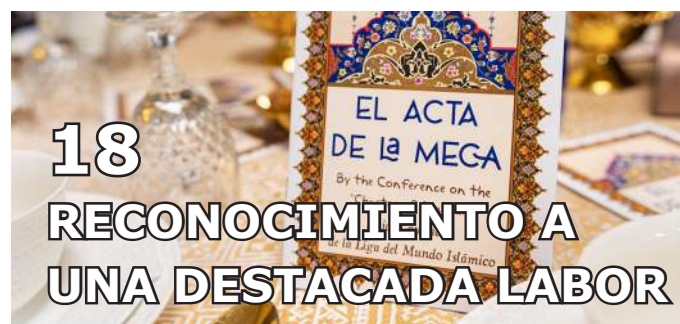
18 RECONOCIMIENTO A UNA DESTACADA LABOR