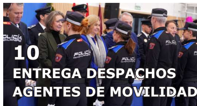
10 ENTREGA DESPACHOS AGENTES DE MOVILIDAD