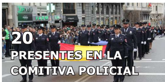
20 PRESENTES EN LA COMITIVA POLICIAL