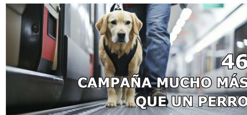
46 CAMPAÑA MUCHO MÁS QUE UN PERRO