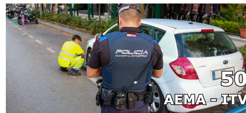
50 AEMA - ITV