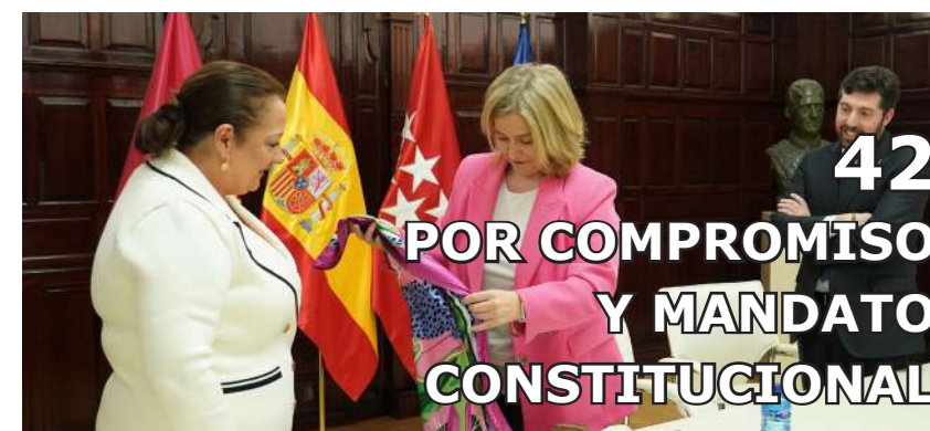
42 POR COMPROMISO Y MANDATO CONSTITUCIONAL