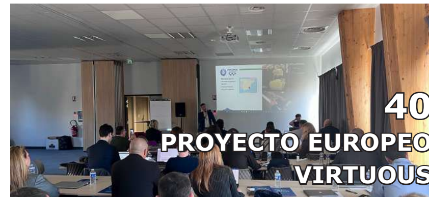
40 PROYECTO EUROPEO VIRTUOUS