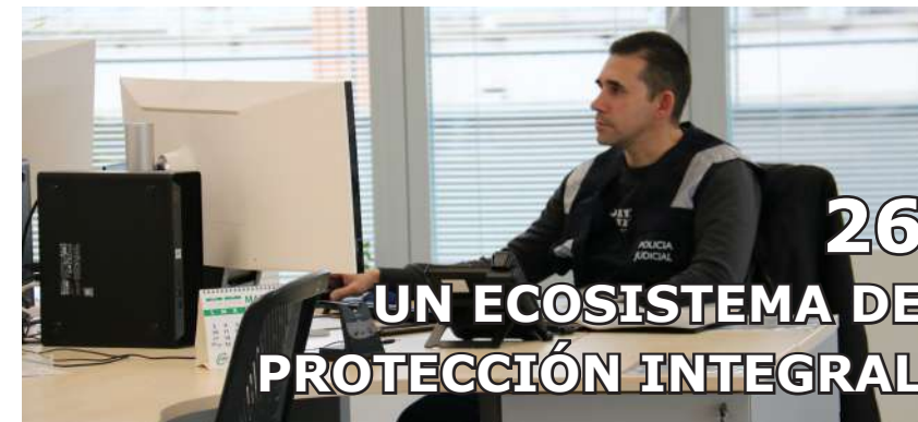
26 UN ECOSISTEMA DE PROTECCIÓN INTEGRAL

50 AEMA ITV - Cumplimiento caducidad ITV