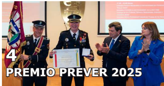
4 PREMIO PREVER 2025