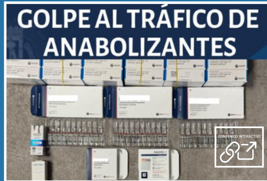
Cae un distribuidor de anabolizantes en plena vía pública. Ocultaba las sustancias en la rueda de repuesto de su vehículo