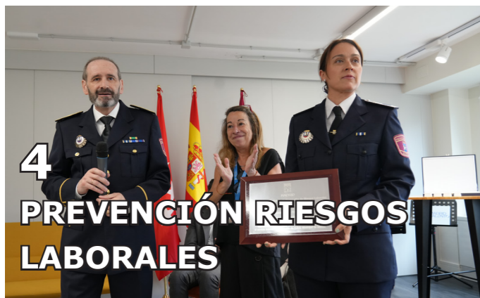
4 PREVENCIÓN RIESGOS LABORALES