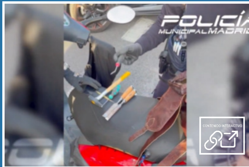
Motocicleta sustraída con útiles para el robo de vehículos

TODAS LAS NOTICIAS IMPORTANTES Y MÁS DESTACADAS EN REDES SOCIALES