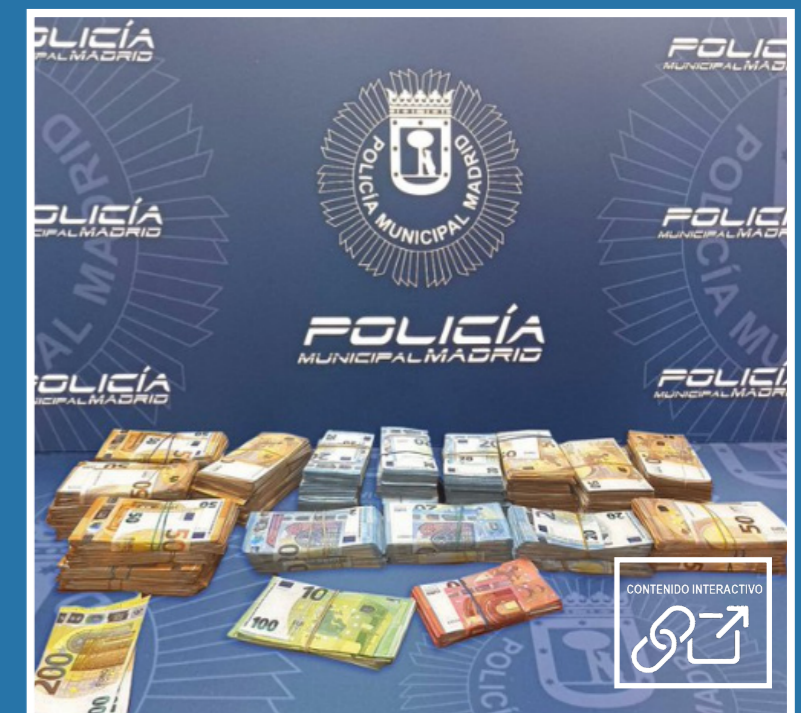
Intervenidos casi 180.000€ escondidos en una maleta en el interior de un vehículo