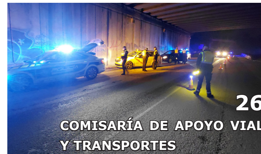
26 COMISARÍA DE APOYO VIAL Y TRANSPORTES