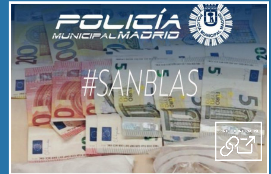
Delito contra la salud pública. Escondían la droga en un hueco del techo de su utilitario