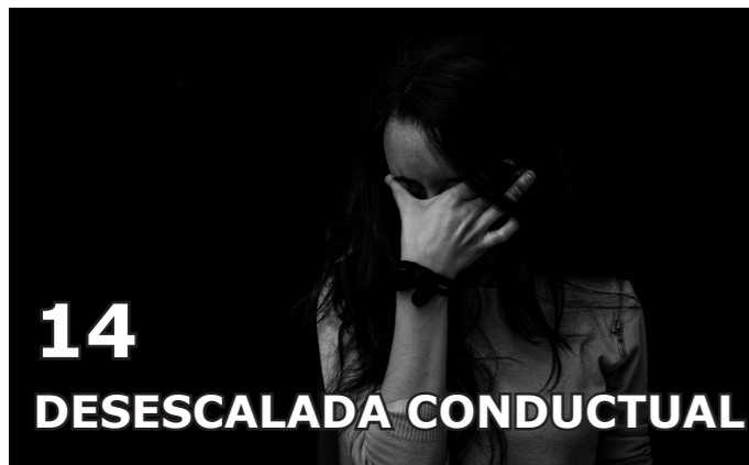
14 DESESCALADA CONDUCTUAL

- Protección de los espacios vulnerables frente a amenazas terroristas