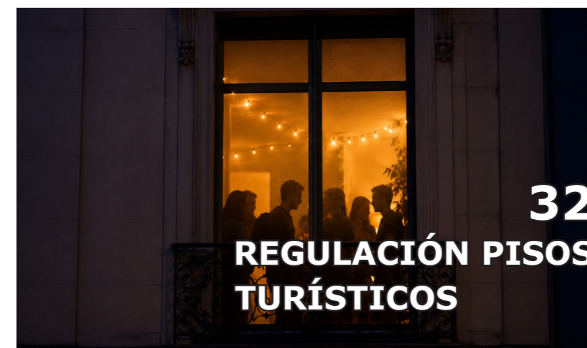
32 REGULACIÓN PISOS TURÍSTICOS

Resultado de las ITV del primer trimestre en la Comunidad de Madrid