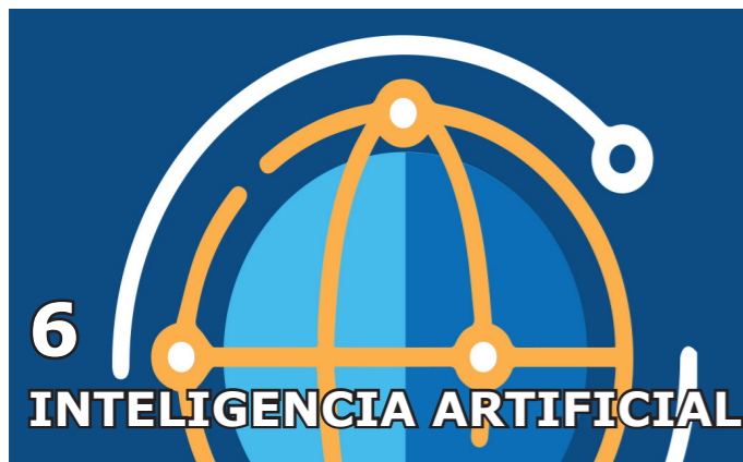
6 INTELIGENCIA ARTIFICIAL

- Nuevo reconocimiento a la labor del SIP - PM