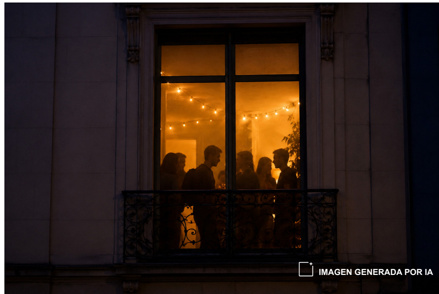
IMAGEN GENERADA POR IA

El propio texto destaca que las modificaciones incorporadas tienen en cuenta, por un lado, la evolución económica y social producida en los últimos años y, además, los distintos pronunciamientos judiciales al respecto. Esto refleja cómo el fenómeno de las viviendas turísticas ha dejado de ser algo puntual para convertirse en una cuestión con gran impacto urbano, turístico y vecinal, donde la regulación busca equilibrar varios intereses como el derecho al desarrollo económico y turístico, la protección de los consumidores y la convivencia ciudadana.