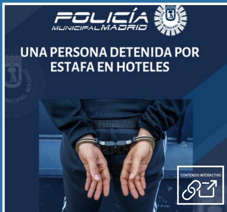
Detenido un varón por estafas continuadas en distintos hoteles de Madrid