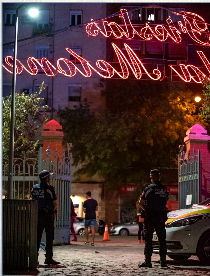
Agentes municipales realizando un control de acceso a la entrada del parque.

Uno de los mandos policiales, responsables de las fiestas de la Melonera, nos indica que el trabajo de la Policía Municipal en estos festejos, consiste en “velar por la seguridad de todos, especialmente de los menores. Hasta que no se marcha el último asistente no abandonamos el recinto ferial. En los controles de acceso a las fiestas, nos aseguramos de que no se introduzca ningún recipiente de vidrio u otros objetos peligrosos en su interior. Entre las intervenciones prioritarias se encuentran las colaboraciones con SAMUR, en los casos en los que se produzca alguna intoxicación por parte de menores, cuyos progenitores en todo caso son contactados”.