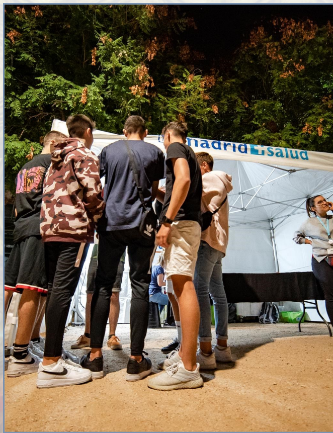
Un grupo de jóvenes recibe información en la carpa de Madrid Salud.