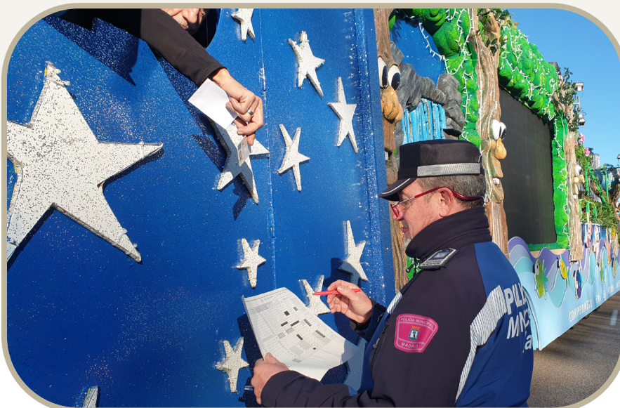
Agentes inspeccionando el conjunto de carrozas e infraestructuras que formaban la cabalgata.

Además fueron instaladas un total de 34 gradas con 68 accesos que completaron un aforo de 9.025 asistentes. No se dejó nada a la improvisación y también fueron dispuestos hasta 9 salidas de emergencia del itinerario principal a lo largo de Castellana-Recoletos y Cibeles.