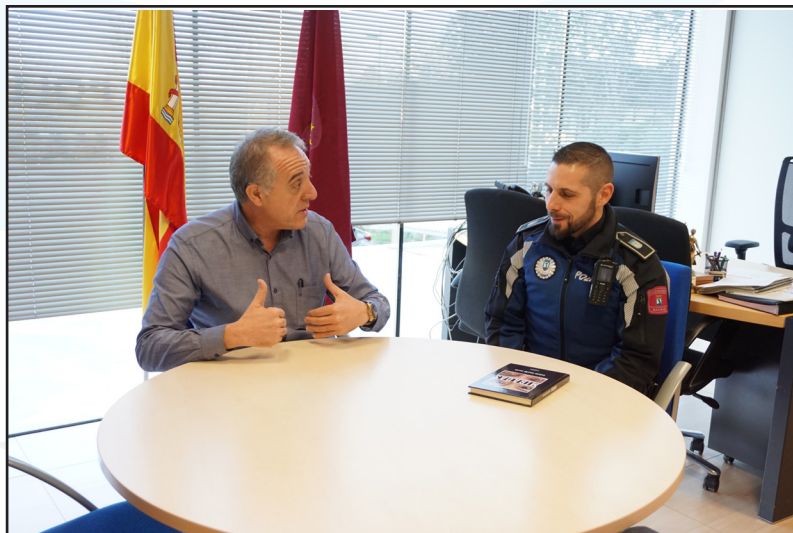
El autor del libro, en la presentación al director de la Policía Municipal.

El director general de la Policía Municipal de Madrid le recibió en su despacho para felicitarle por su primera incursión en el mundo de la literatura, en la que le deseo éxito y continuidad. La reseña de este pequeño libro y de su autor permite hacer de nuevo protagonista a una Unidad que suele aparecer en las páginas de esta revista con cierta frecuencia por sus funciones operativas de apoyo a los distritos.