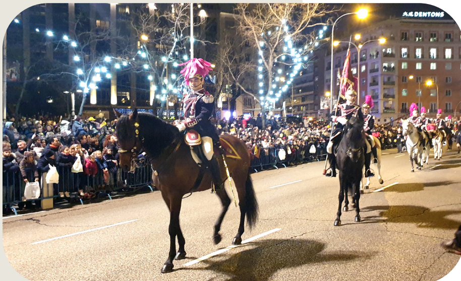
Agentes de la unidad del escuadrón flanqueando las carrozas de SSMM los Reyes Magos.

El Escuadrón de Caballería del Cuerpo, con uniformidad de gala contribuyó al protocolo que requería esta jornada inolvidable y flanquearon las carrozas igualmente engalanadas. También hicieron acto de presencia los perros de la Sección Canina que, junto con sus guías, prestaron un servicio de apoyo a la seguridad de los espacios por donde discurría la Cabalgata y esperaba su expectante auditorio.