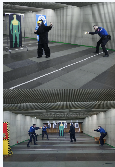
Instantáneas de la práctica con el dispositivo taser.

Indicar que cada carga está registrada mediante un código QR que llevan impreso. En la actualidad, ya han sido formados veinte policías, que serán monitores de cursos sucesivos, y otros doce efectivos con formación como operadores. El curso de monitor tiene una duración de 30 horas lectivas y el de operador, 10 horas. Tras la formación se emite el certificado y habilitación para el uso de este dispositivos electrónico y control (DEC). La formación proseguirá en el Centro de Formación de Seguridad y Emergencias del Ayuntamiento de Madrid (CIFSE), mediante una programación de 20 cursos para 20 alumnos cada uno de ellos y que permitirán formar a 400 policías en el periodo académico 2020-21. Las acciones formativas han recogido las diferentes normativas internacionales de derechos humanos, incluidas las directivas europeas y nacionales sobre esta dotación.