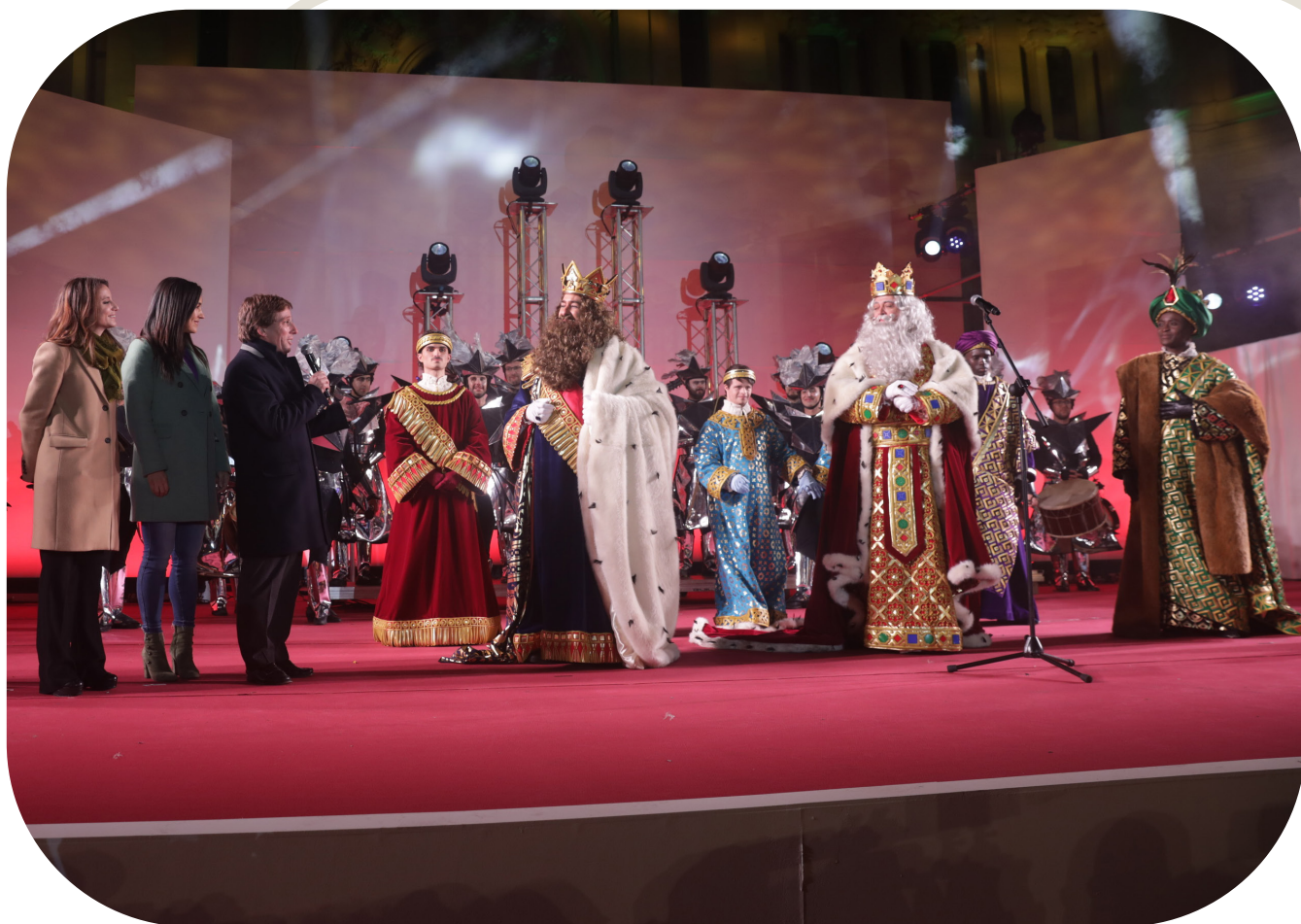
SSMM los Reyes Magos en la tribuna del Palacio de Cibeles junto al alcalde de Madrid, Martínez Alméida; la vicealcaldesa de Madrid, Begoña Villacís; y Andrea Levy, delegada del Área de Gobierno de Cultura.

Estaba todo preparado para que no hubiera ningún tipo de incidencia y todo el mundo pudo disfrutar de un espectáculo de arte, magia, imaginación, animación y sobre todo de los Reyes, que eran llamados constantemente desde la grada. Fueron desplegados emplazamientos para pequeños con discapacidad o personas con problemas de movilidad para que no se perdieran el paso de las comitivas Reales.