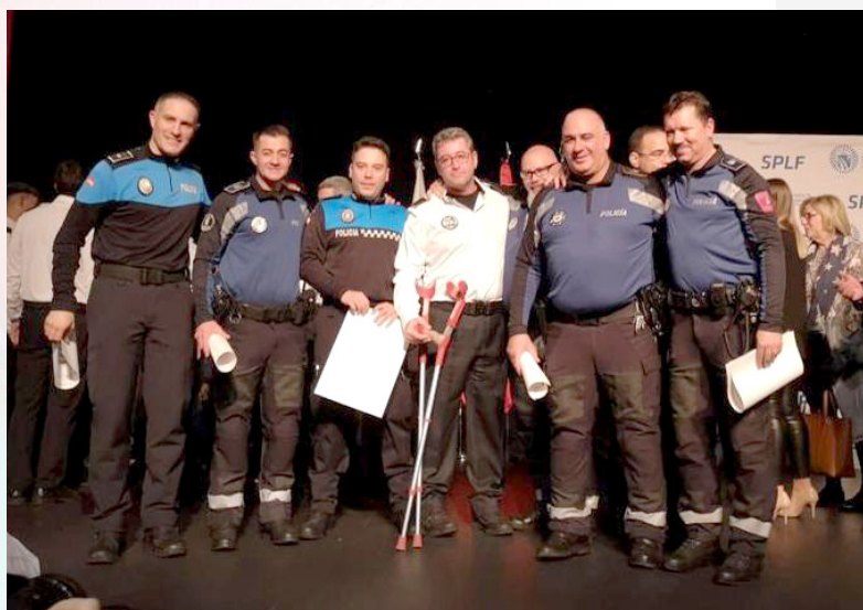
Uno de los momentos del acto junto al agente accidentado