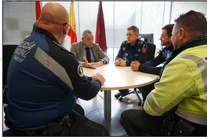
Los agentes, en un momento de la recepción.

La Dirección General de la Policía Municipal y la Jefatura felicitan a los agentes que salvaron la vida a un motorista gravemente accidentado