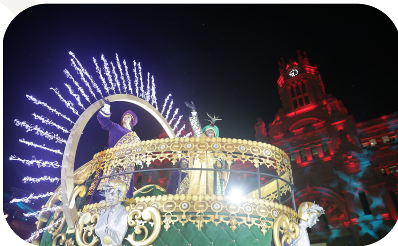
Una de las carrozas de SSMM los Reyes Magos, a su paso por el Palacio de Cibeles.

Finalmente SSMM los Reyes Magos acudieron acompañados por agentes municipales de la Unidad de Apoyo a la Seguridad hasta la tribuna instalada en el Palacio de Cibeles. Allí fueron recibidos por las autoridades municipales que les dieron la bienvenida. Los Reyes tomaron la palabra para felicitar a los niños y niñas por su comportamiento, anticipándoles que seguramente no les faltaría ningún juguete, aunque les esperaba una tarea ingente. No quisieron olvidarse de los pequeños más desfavorecidos, de cuyas circunstancias no hay que olvidarse y para los que también habría regalos.