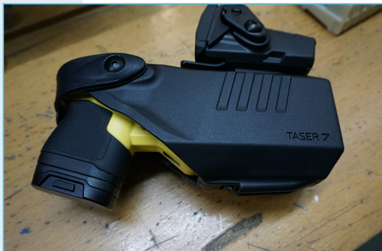
El dispositivo taser en su funda.