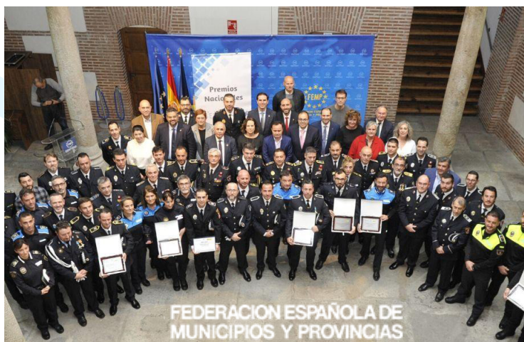
* Los galardonados en la primera edición de Premios Nacionales de la Federación Española de Municipios y Provincias.

En concreto el recibido por los agentes tutores de la Policía Municipal de Madrid pertenece a la categoría de INNOVACIÓN, por su proyecto “Programa Zonas Libres de Acoso”.