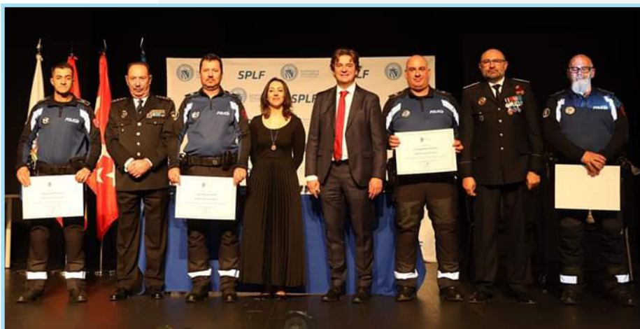
Los agentes de Policía Municipal recibiendo el premio del Ayuntamiento de Fuenlabrada.

Cuando los agentes llegaron a las instalaciones de formación de la DGT, en Mérida, ya se conocía el accidente en el que los agentes acababan de intervenir, porque el motorista auxiliado resultó ser un policía local de Fuenlabrada que iba en su motocicleta a uno de estos cursos.