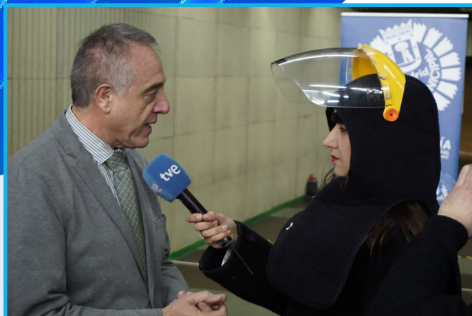
El director entrevistado por la reportera de TVE 1 que se prestó a la exhibición.

El Ayuntamiento de Madrid apuesta por que los policías de la capital cuenten para ciertas situaciones o intervenciones, con un dispositivo intermedio entre la defensa y el arma de fuego y, que con su uso, se minimicen riesgos tanto para los agentes como para las personas agresoras, violentas o que empleen armas.