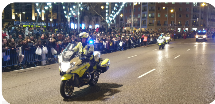
Agentes de la Unidad Especial de Tráfico escoltando a sus majestades los reyes.

Agentes de Policía Municipal de Madrid estuvieron presentes durante todo el desarrollo de la Cabalgata, algunos de ellos, incluso desde días antes organizando la movilidad y la seguridad de la zona mientras se desarrollaron las múltiples labores de todas las instalaciones y montajes que requiere un espectáculo tan excepcional como el que requiere la llegada de los Magos a la capital.