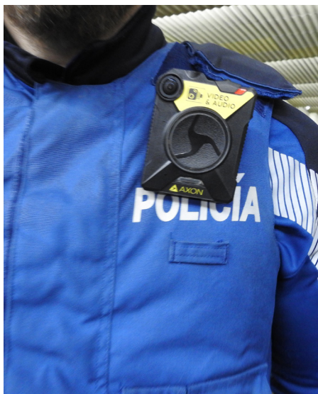
Detalle de la cámara sobre la uniformidad.

Se ha procedido a la compra, a través de un contrato menor, de 4 dispositivos “Taser modelo 7”, que se complementan con cámaras personales de video, para grabar las intervenciones en las que se utilicen estos dispositivos. La grabación constituye, además, una garantía del desarrollo de la intervención.