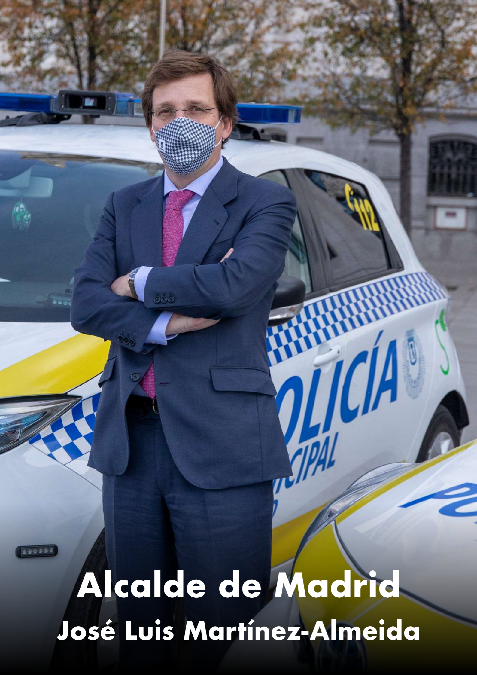
Alcalde de Madrid José Luis Martínez-Almeida