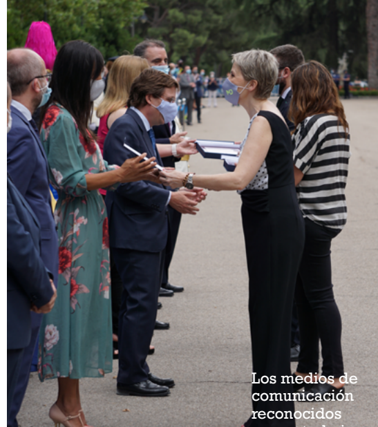
Los medios de comunicación reconocidos por su trabajo

tinguió también el trabajo de los medios de comunicación que, en esta ocasión, fueron representados por el programa Madrid Directo, de TeleMadrid, la agencia de noticias Europa Press y el diario ABC. El 092 y la Unidad de Relaciones Institucionales recibieron sendas metopas identificativas de su cincuenta aniversario y la labor de difusión pública de las actuaciones del Cuerpo, respectivamente.