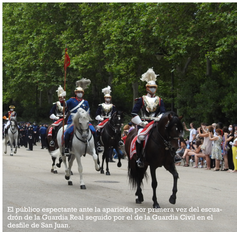
El público espectador ante la aparición por primera vez del escuadrón de la Guardia Real seguido por el de la Guardia Civil en el desfile de San Juan.

Tras ellos, discurrió una muestra de los vehículos de las distintas Unidades, muchos de ellos, no contaminantes, como el Mitsubishi Outlander, ZOE, Toyota Prius-Plus, Seat León TGI de las Unidades Integrales de Distrito , o las motocicletas ZERO FX6.5 de la Unidad de Medio Ambiente . También pudieron ser vistas las scooter Piaggio MP3 destinadas a los distritos y motocicletas de alta cilindrada BMW RT1200 de la Unidad Especial de Tráfico , encargadas de servicios de escolta, o desplegadas en servicios extraordinarios de tráfico, y de la seguridad vial en la Calle 30. En el desfile, fue estrenada la nueva imagen corporativa de los vehículos utilizados por los equipos de la UAS .