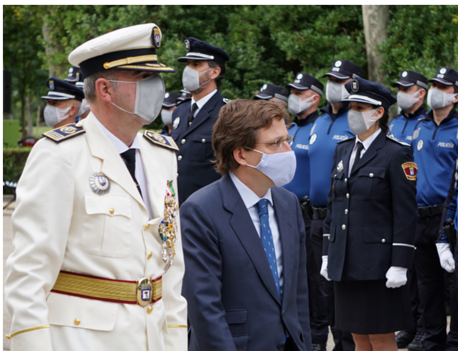
El alcalde acompañado por el comisario general pasando revista