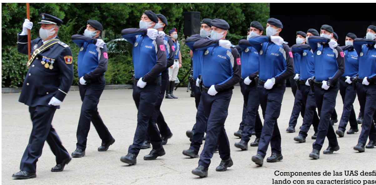
Componentes de las UAS desfilando con su característico paso