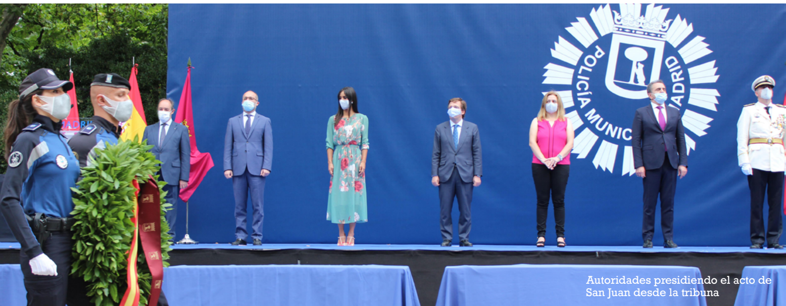
Autoridades presidiendo el acto de San Juan desde la tribuna