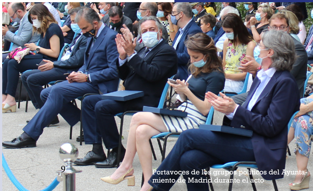
Portavoces de los grupos políticos del Ayuntamiento de Madrid durante el acto

Al término de los reconocimientos, el alcalde y el comisario general colocaron una corona de flores ante el Monumento a los Caídos, que sumó al recuerdo de los componentes fallecidos en acto de servicio el de tantas personas que perdieron su vida tras sucumbir a la enfermedad de la COVID-19. Al término del Acto Solemne y fuera de la agenda prevista, el alcalde, en compañía de las autoridades y mandos del Cuerpo, quiso acercarse al pebetero en memoria de los fallecidos por la COVID-19, para con-