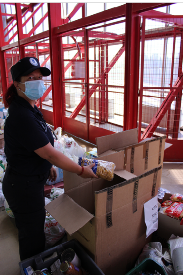
Los auxiliares de Policía Municipal dispusieron los alimentos para su traslado

El presidente del Banco de Alimentos explicó a los asistentes que “el fundamento de su organización es la repartir de alimentos, por eso su principal preocupación es el aprovisionamiento de ellos para poder después distribuir a las personas más desfavorecidas mediante el trabajo de las diferentes entidades” . El presidente siguió destacando “la generosidad de la Policía Municipal, personas entregadas, que se han redoblado en su trabajo durante estos meses, y que han tenido además la generosidad para conseguir todos estos artículos que ahora se entregan al Banco de Alimentos” .