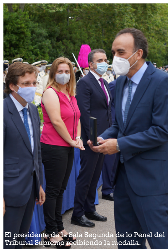
El presidente de la Sala Segunda de lo Penal del Tribunal Supremo recibiendo la medalla.

sanitaria, ha sido el mismo teléfono de ayuda y confianza para el ciudadano”.