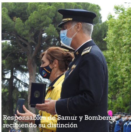
Responsables de Samur y Bomberos recibiendo su distinción

tinguió también el trabajo de los medios de comunicación que, en esta ocasión, fueron representados por el programa Madrid Directo, de TeleMadrid, la agencia de noticias Europa Press y el diario ABC. El 092 y la Unidad de Relaciones Institucionales recibieron sendas metopas identificativas de su cincuenta aniversario y la labor de difusión pública de las actuaciones del Cuerpo, respectivamente.