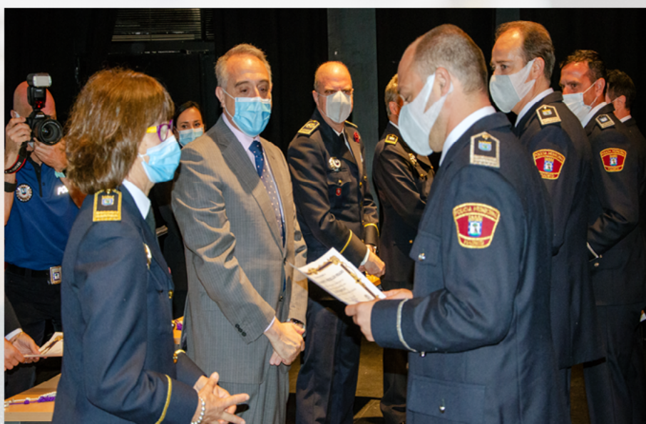
Los nuevos subinspectores reforzarán el servicio de los distritos.

También tuvo un especial recuerdo a las familias de los agentes, y agradeció “el apoyo que han mostrado a los mismos y que ha coincidido con una especial carga de trabajo para el Cuerpo de policía Municipal durante este periodo de pandemia” .