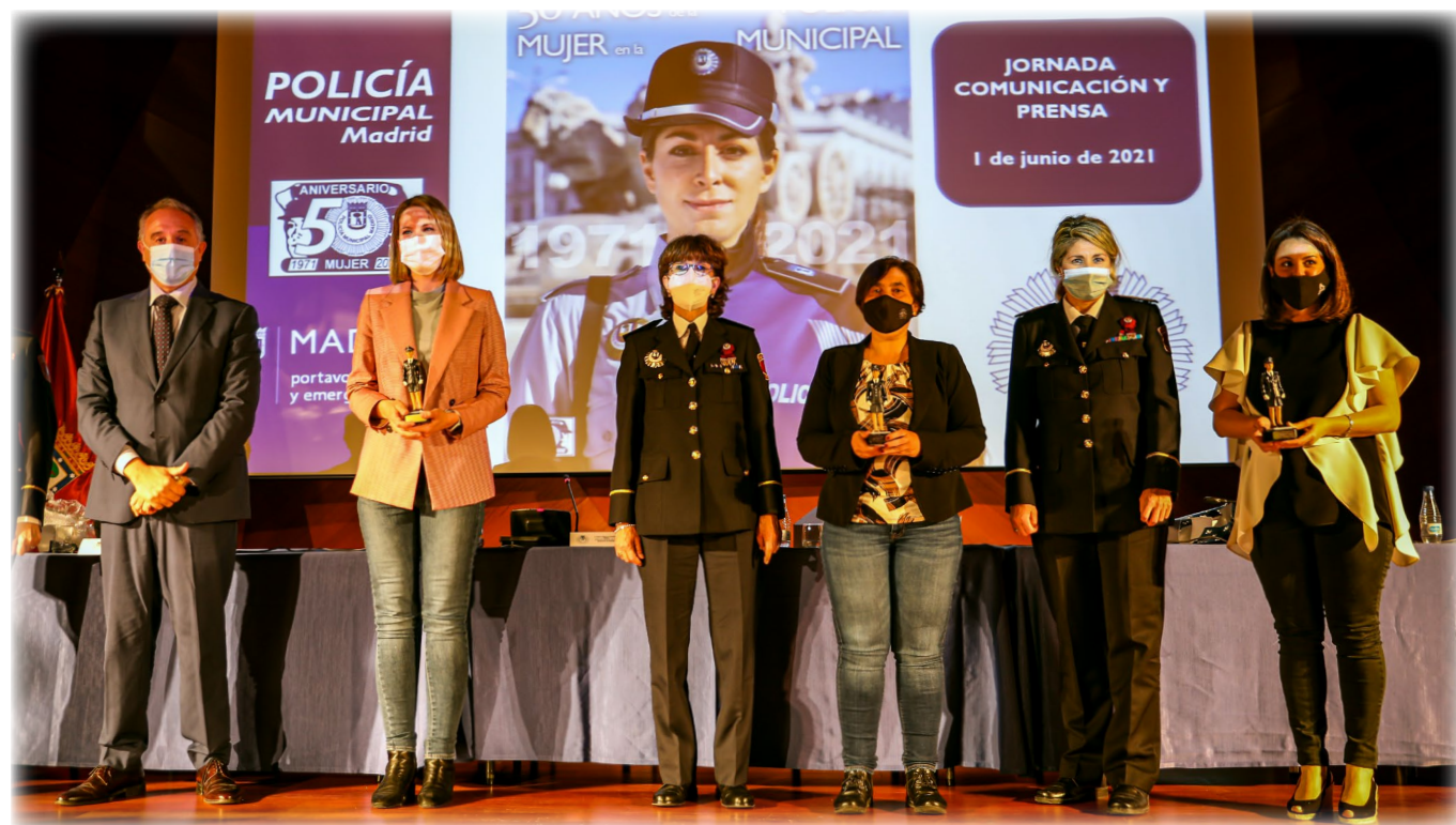
Redacción revista POLICÍA MUNICIPAL DE MADRID