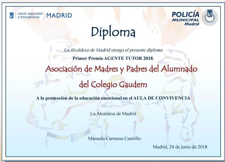
Diploma entregado por la Sra. Alcaldesa el día de San Juan a la AMPA Colegio Gaudem

Aprovechamos este apunte de agenda para felicitar una vez más, a los galardonados del curso 2017-18, la Asociación de Madres y Padres del Alumnado del Colegio Gaudem y el Colegio Paraíso Sagrado Corazones.