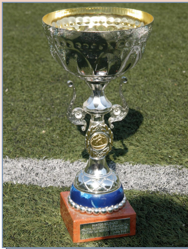
X Trofeo del encuentro por la integración.