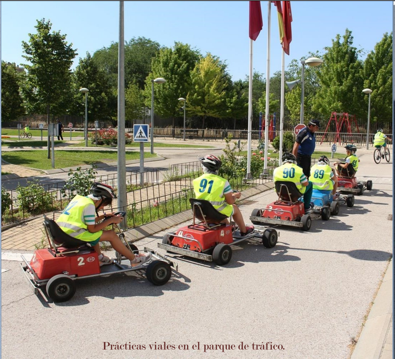
Prácticas viales en el parque de tráfico.

A continuación explicamos brevemente el contenido de los cursos de educación vial impartidos por los monitores.