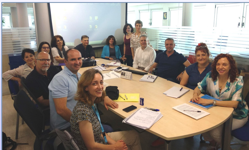
Miembros de la Comisión de Adicciones posan para la revista C&P.

Los colegios dispondrán de una nueva herramienta informática con la que activar los recursos que se precisen en situaciones de adicción, detectadas en el ámbito escolar