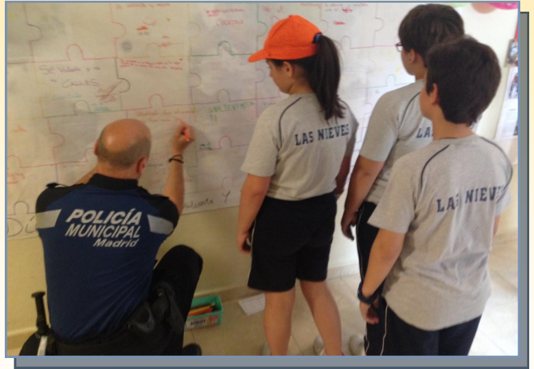
Un agente tutor en clase, acompañado de alumnos.

Los agentes tutores reciben una formación especializada y poseen la capacitación para actuar de la forma más adecuada en conflictos, tanto de naturaleza administrativa, como penal ocurridos en el entorno escolar, familiar y social. Las dos características de servicio que definen su naturaleza son la proximidad y la integración en los entornos escolares.