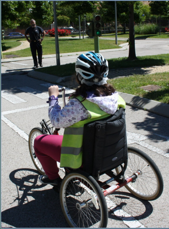
Una alumna con vehículo adaptado.

La agenda de los monitores tiene en cuenta las necesidades de formación de los usuarios más mayores y acuden a sus centros y residencias para dar a conocer los consejos más importantes para esta población: conducta peatonal segura y atención al momento crítico del cruce de la calzada. Los monitores también acuden a los colegios de educación especial, que lo solicitan. Imparten formación igualmente a los jóvenes y adolescentes que se encuentran en los centros de Ejecución de Medidas Judiciales por la comisión de infracciones penales; en este caso las charlas permiten generar, además conexión y confianza con los agentes.