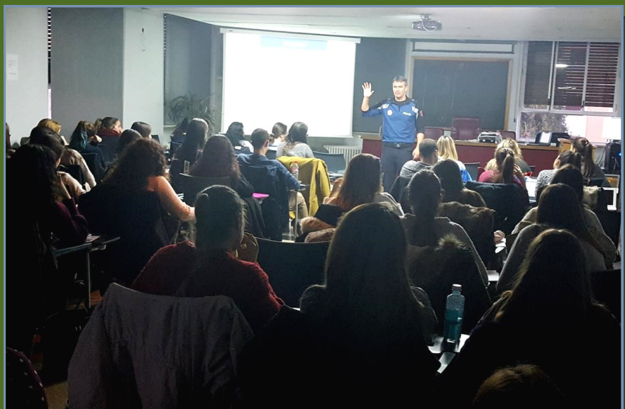
Una charla de educación vial a universitarios.