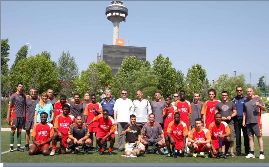
Los dos equipos, el de los agentes municipales -de gris— y La Merced ganaron una vez más el partido de la confianza y la integración.

El pasado mes de junio tuvo lugar un partido de fútbol con dos equipos que se conocen bien. Los agentes tutores, junto con otros compañeros de la Unidad Integral del Distrito de Salamanca, y jóvenes de origen inmigrante que han protagonizado historias difíciles, ya superadas, disputaron un encuentro deportivo, que terminó con un marcador implacable en contra de los agentes.