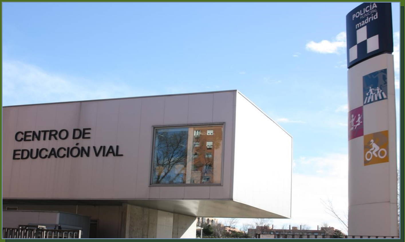
Unidad de Educación vial en el distrito de Moratalaz.

Actualmente la Unidad de Educación Vial y Cívica cuenta con 73 policías monitores especializados en educación vial y cívica, que imparten clase a cerca de 200.000 alumnos, desde el nivel de infantil hasta bachillerato; enseñando conceptos y prácticas viales, en función de las edades y condición de usuario de las vías públicas. Las clases alcanzan a un total de 638 centros educativos de la capital. El objetivo consiste en avanzar en la concienciación frente al accidente de tráfico y la prevención de todas aquellas conductas que ponen en riesgo la seguridad de todos en la vía, transmitiendo y compartiendo la cultura de tolerancia cero ante la violencia vial y la movilidad sostenible.