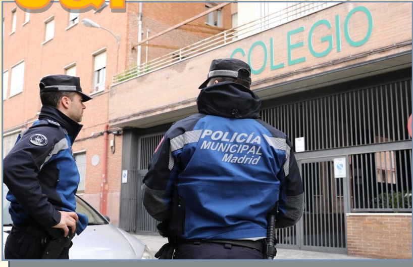
Agentes tutores vigilando el entorno de un colegio.

Los agentes están especializados en nuevas tecnologías, uso de redes sociales, responsabilidad penal del menor, violencia de género juvenil y mediación escolar