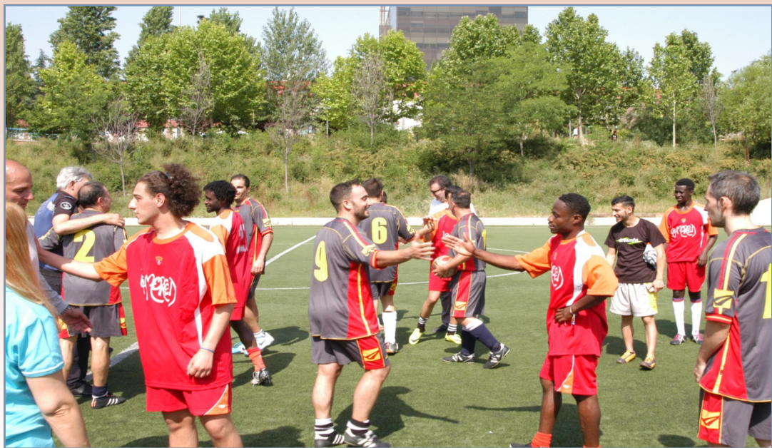
Los agentes y los jóvenes migrantes se saludan amistosamente al término del partido.

Al finalizar el encuentro, ambos equipos disfrutaron juntos de un desayuno en las propias instalaciones deportivas, con la meta ya puesta en el encuentro del próximo año y con el firme convencimiento, tal como aseguran el padre Luis y el agente tutor Álvaro de que “entre todos sumamos más, y todos ganamos” .