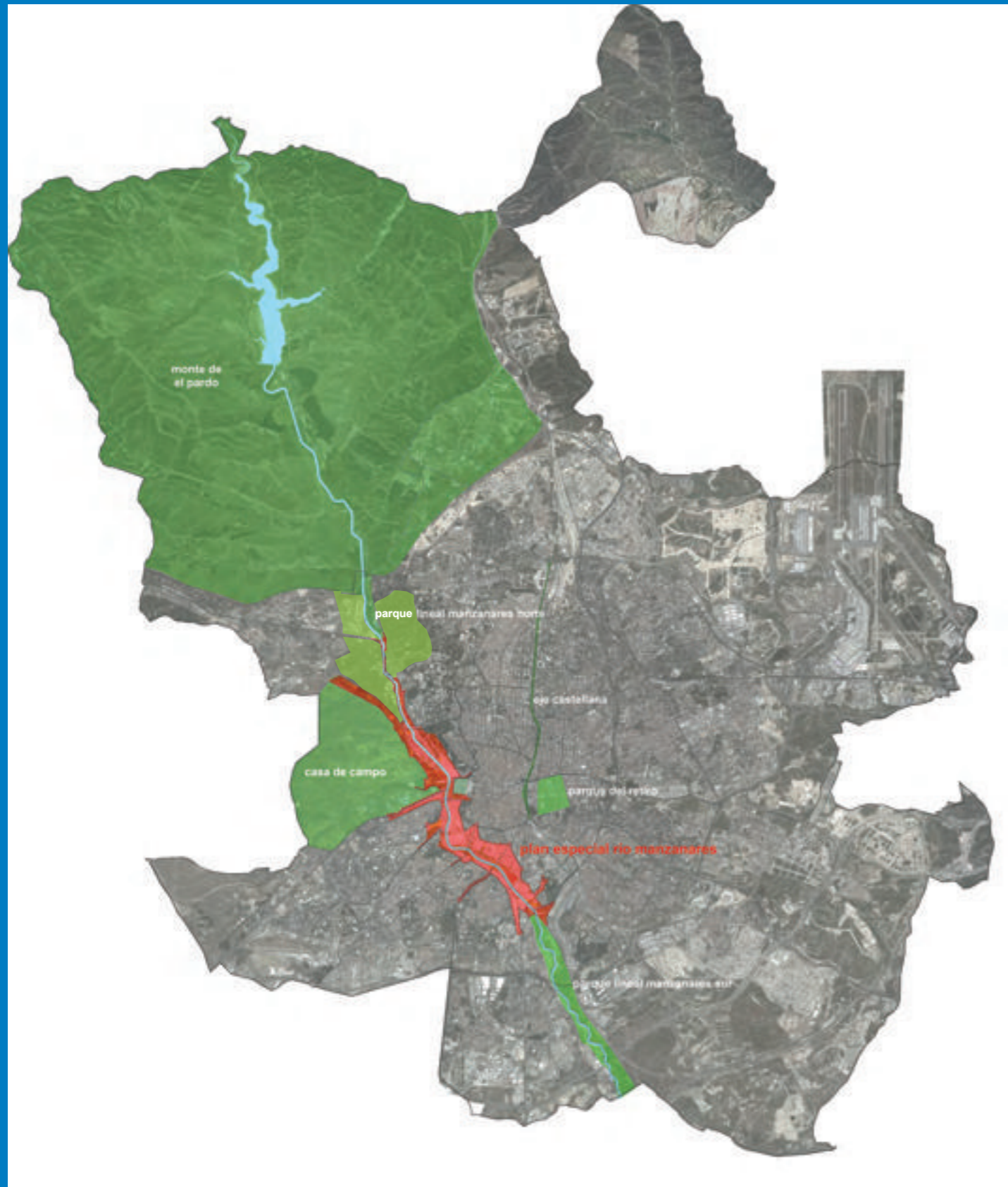
Ámbito de Madrid Río y corredor ambiental Getafe - El Pardo