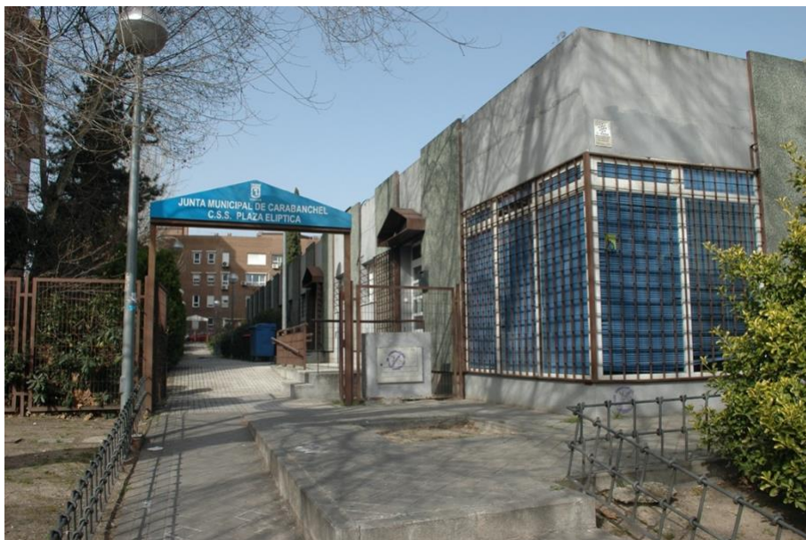
Centro de Servicios Sociales de Plaza Elíptica de Madrid

El Centro que te corresponde puedes encontrarlo en el apartado anterior de esta guía.