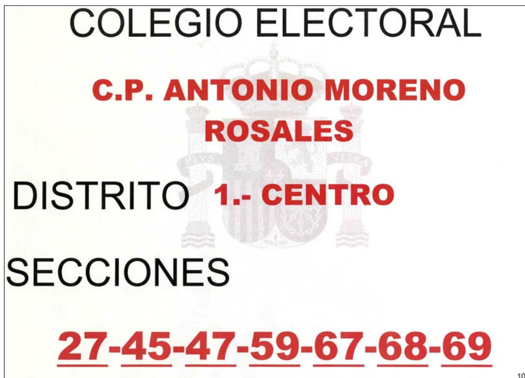
Figura 1. Cartel de “Colegio Electoral”

A continuación se muestra, a modo de ejemplo , una copia de los modelos de señalización del colegio relacionados en el epígrafe IV.