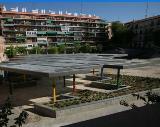
Vista de las nuevas jardineras y pérgola en la Plaza de Agustín Lara.