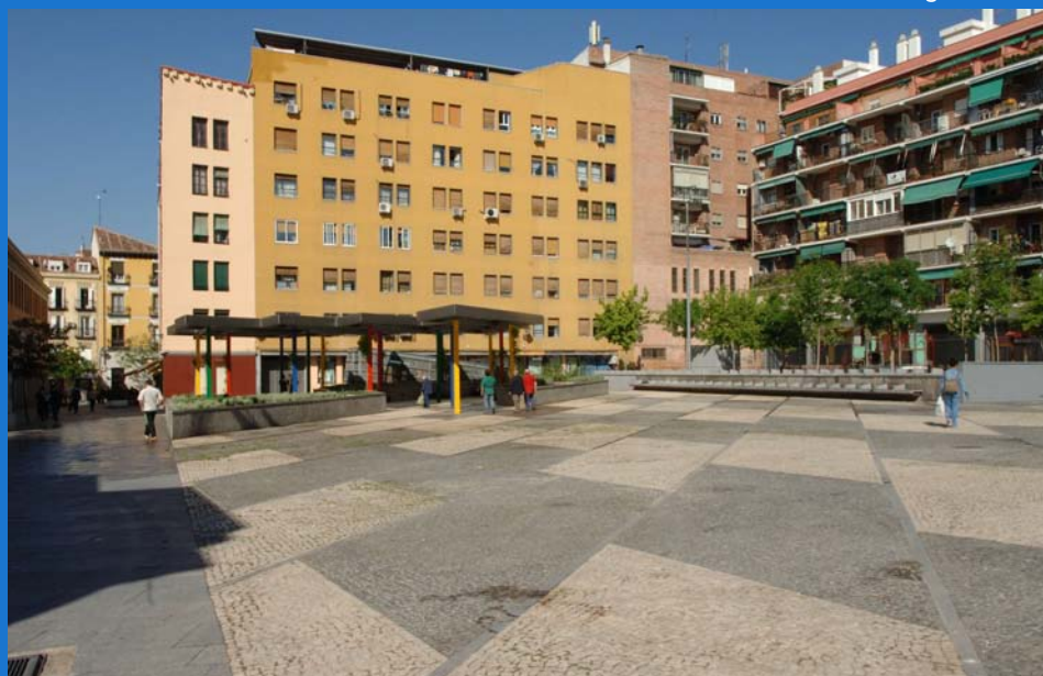
Plaza de Agustín Lara.