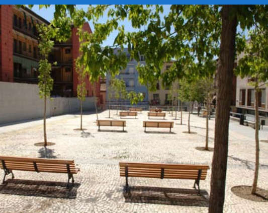
Plaza de La Corrala.