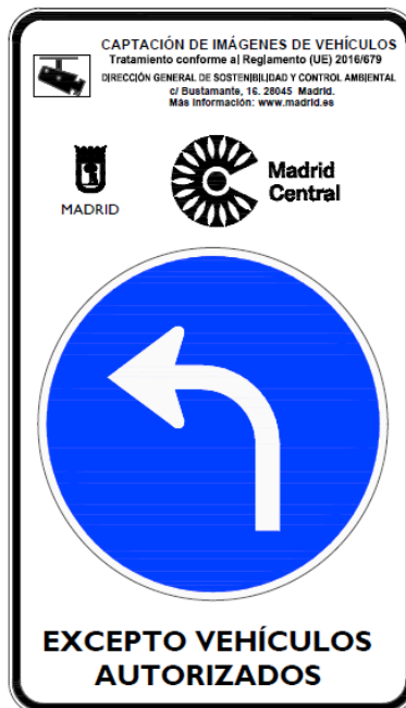
Preseñalización R-400 e de 60 cms. diámetro