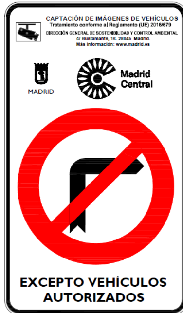
Preseñalización R-302 de 60 cms. diámetro