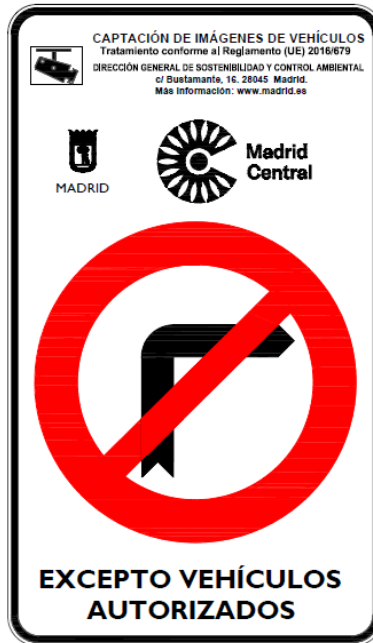
Preseñalización R-302 de 60 cms. diámetro