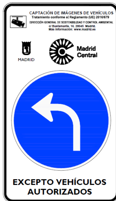
Preseñalización R-400 e de 60 cms. diámetro