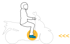
Conductores de ciclomotores