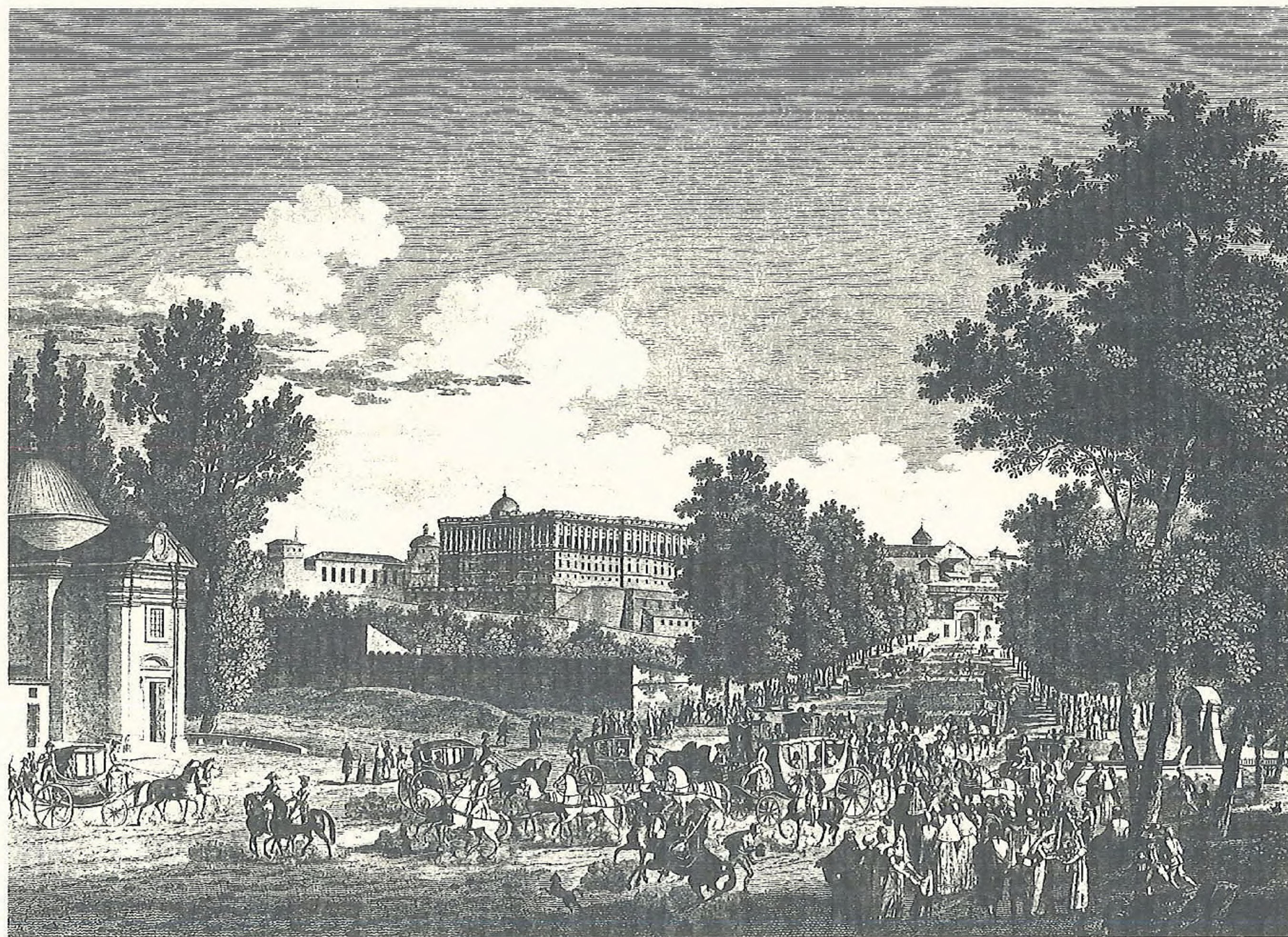
VISTA de la FLORIDA en MADRID.