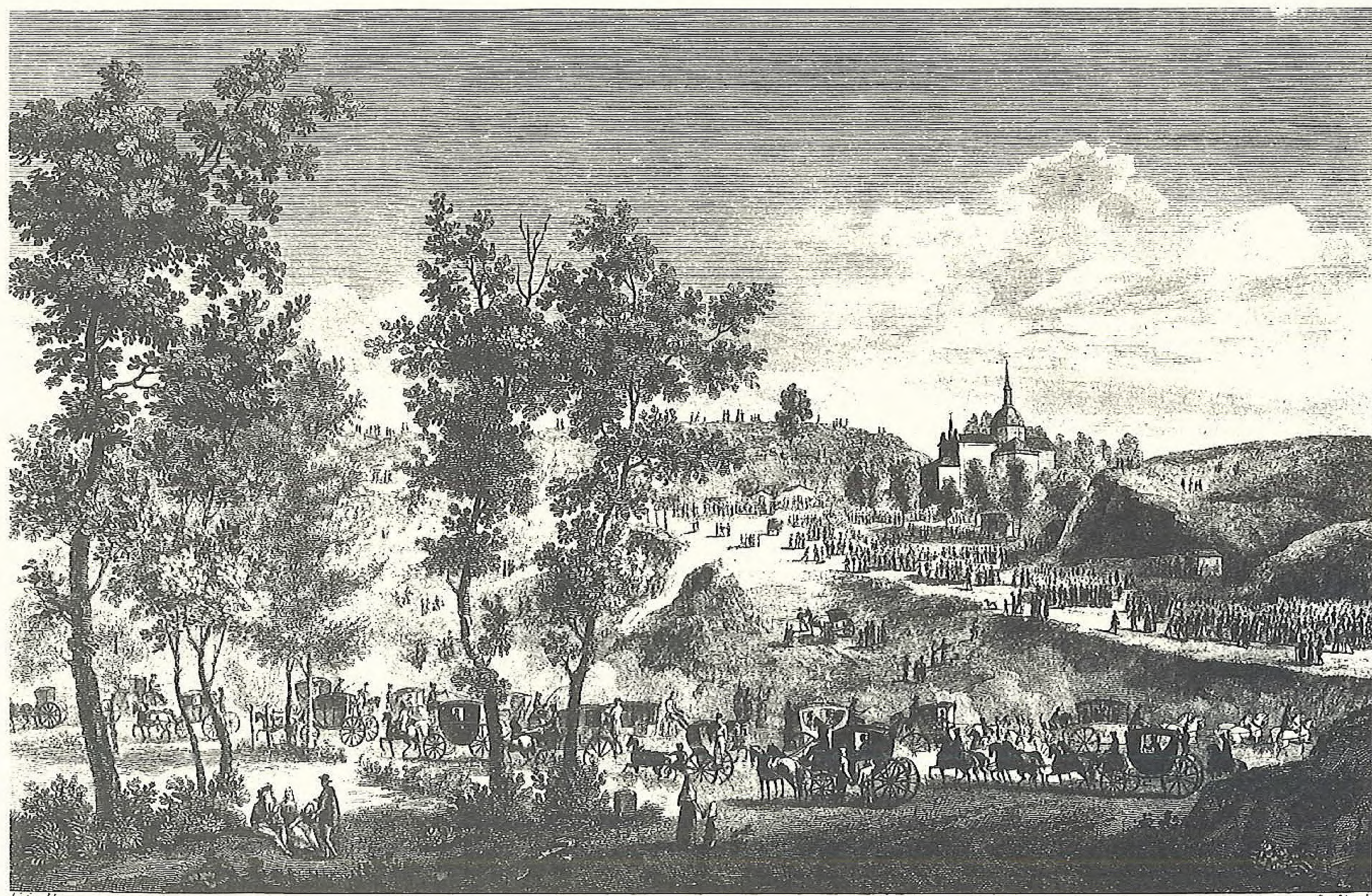
VISTA de la HERMITA y de la FIESTA de San ISIDRO en MADRID.