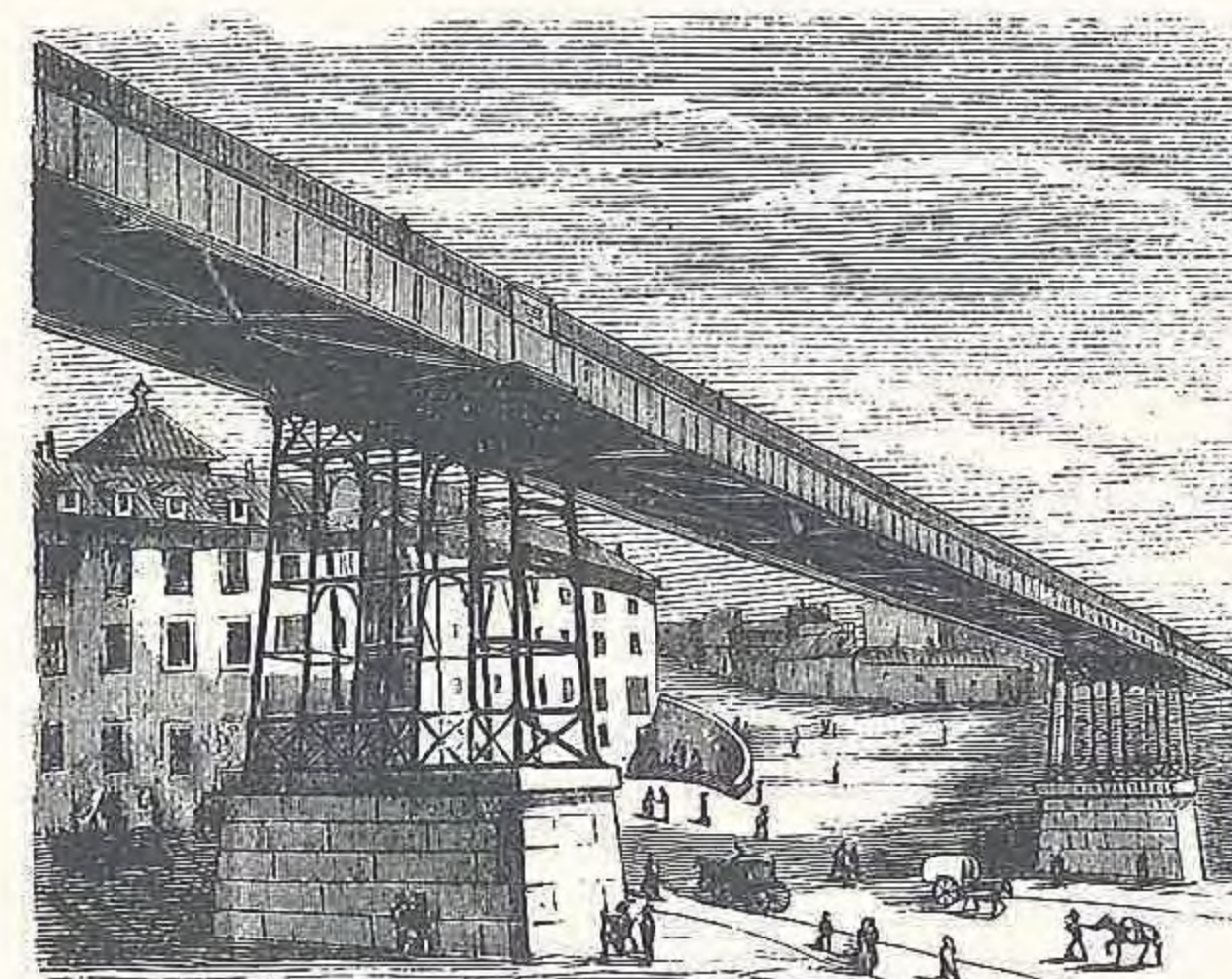
Viaducto sobre la calle de Segoría.

— El empresario británico Robert Owen, implanta en su fábrica de hilatura de algodón la jornada de trabajo de diez horas y media y prohíbe que trabajen niños menores de diez años.