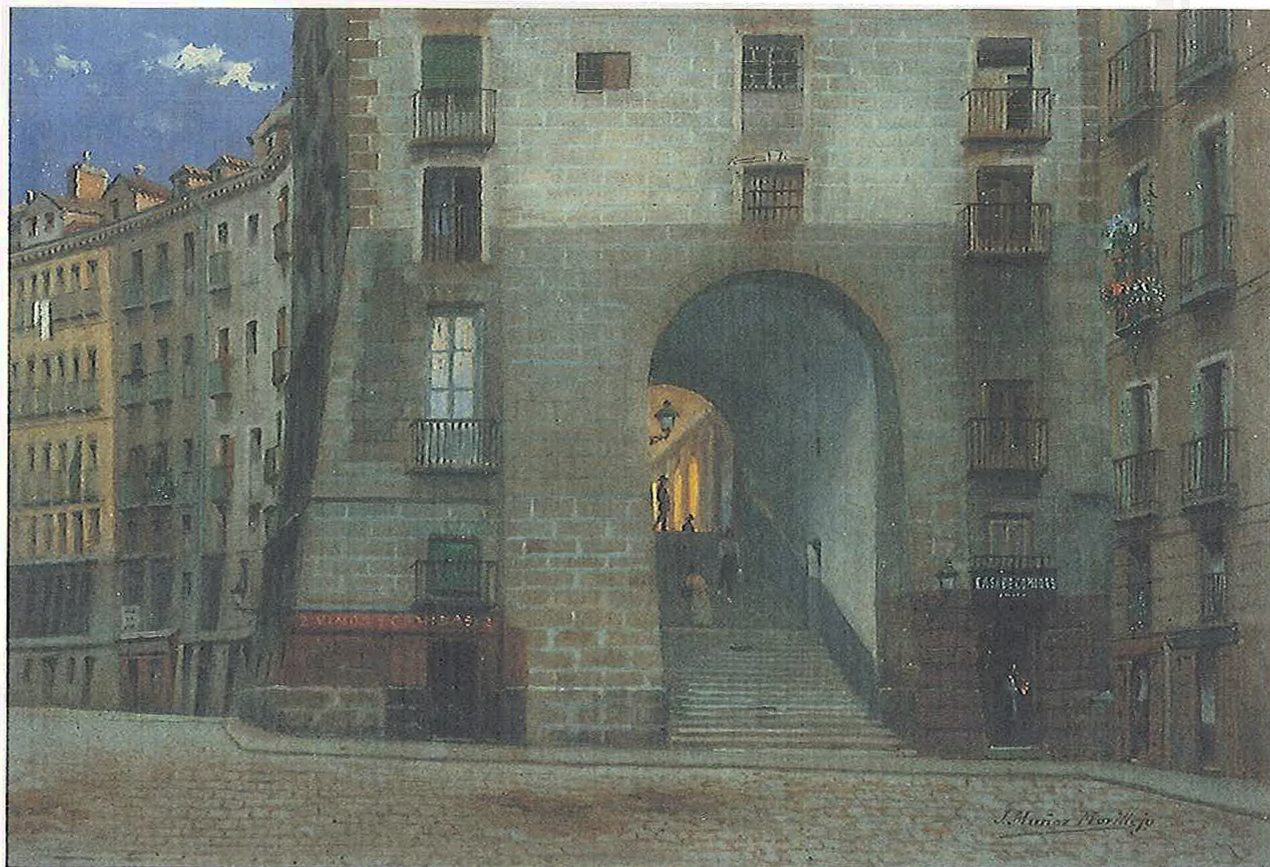
El arco de cuchilleros. J. Muñoz Morillejo

talación de un templete que daba acceso a la estación del Metro de la Red de San Luis, En 1.917 se inició la segunda fase que comprendía Red de San Luis Plaza del Callao. Sólo quedaba el tramo Plaza de Callao Plaza de España que fué terminado en 1.929.