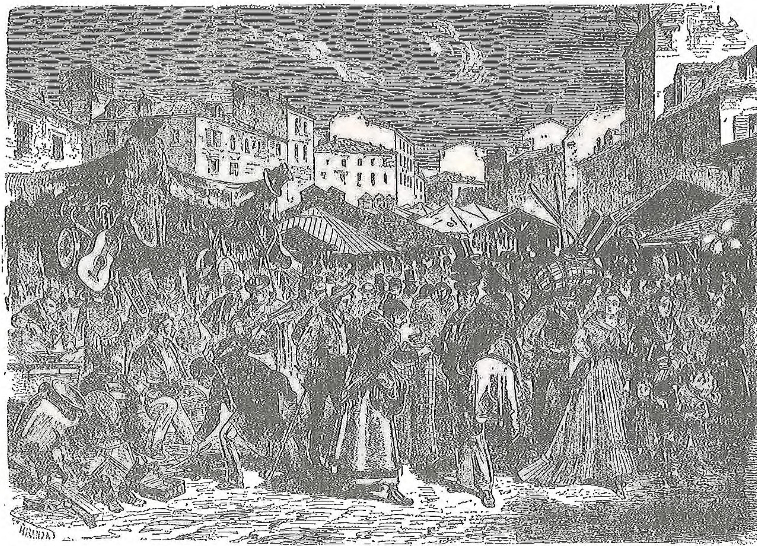
El Rastro de ayer