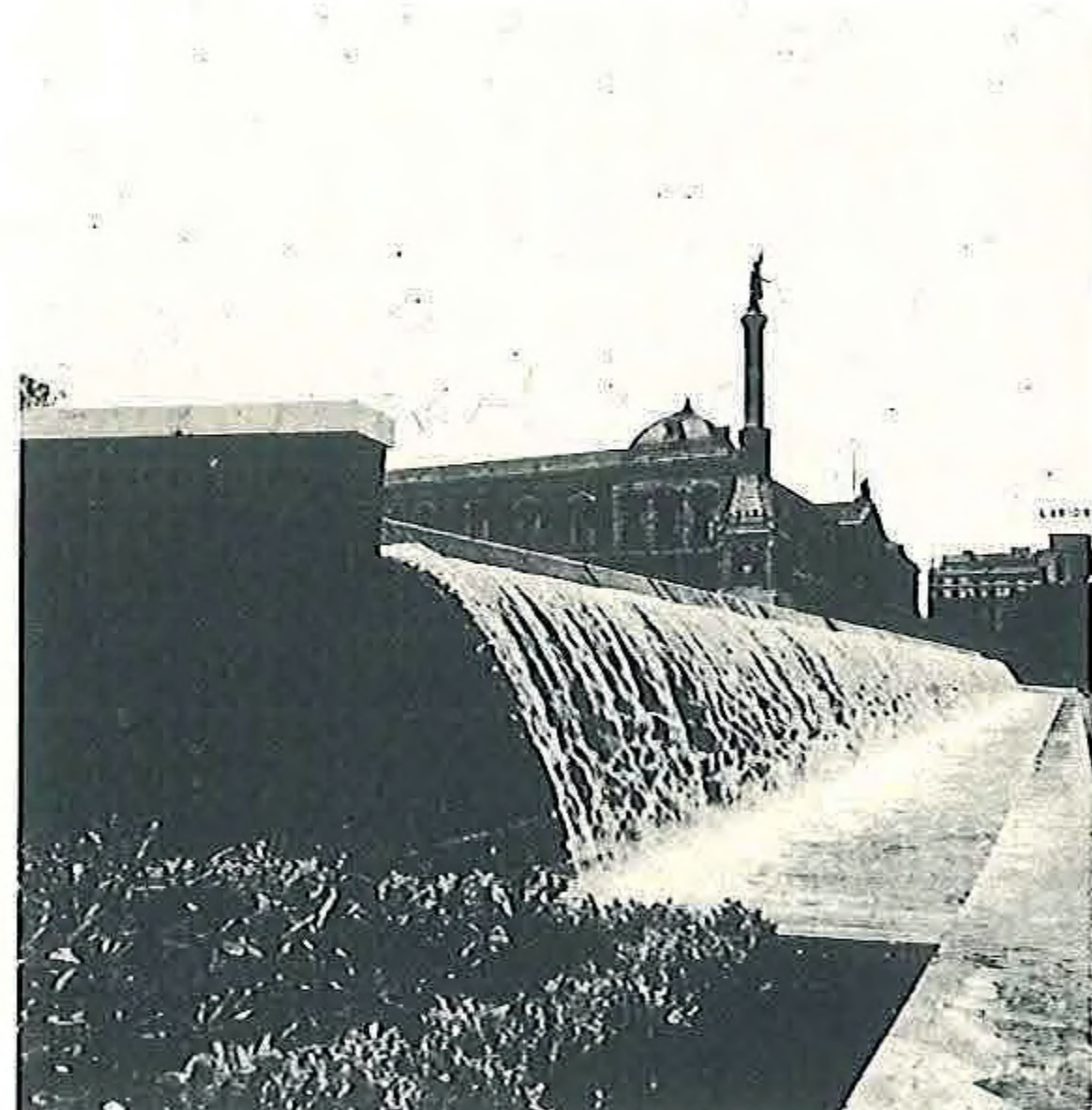
Plaza del Descubrimiento y Centro Cultural Villa de Madrid. 1977.