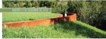
JORNADA DE ACCESIBILIDAD AL PATRIMONIO INMUEBLE. Nuevo estándar y realizaciones