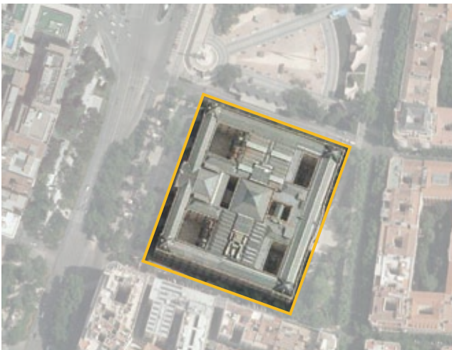
Situación del Museo.

En febrero de 2007 se solicitó licencia de obras, para cuya realización se inició la tramitación de un Plan Especial, que sobre pasaba lo dispuesto en el artículo 4.10.6 de las Normas Urbanísticas por lo que fue necesario tramitar una Modificación de Plan General.