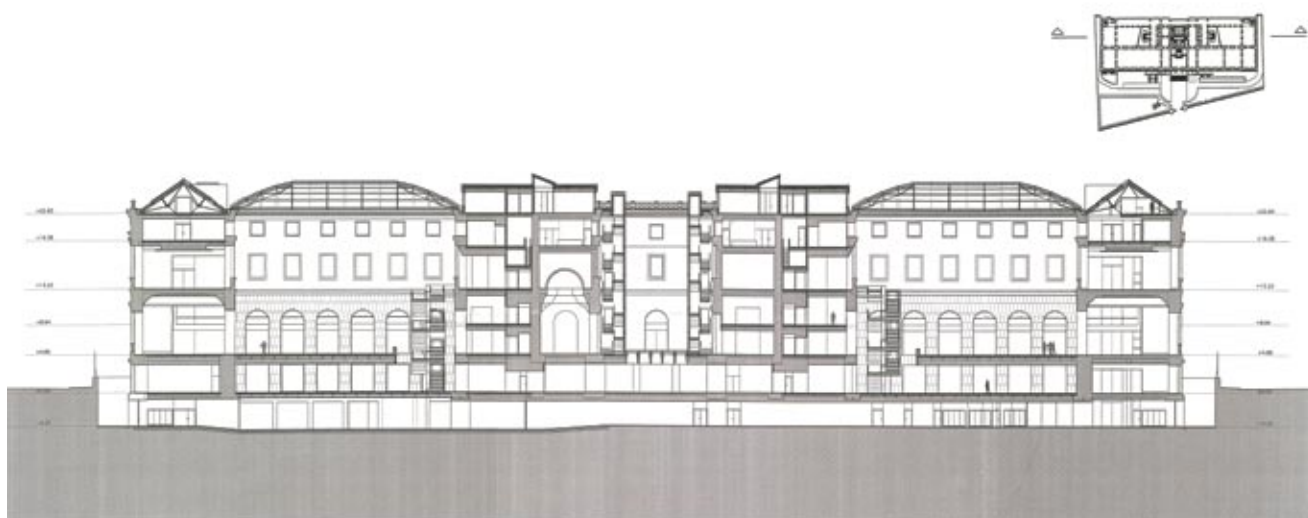
Sección longitudinal propuesta.

Actualmente se encuentra pendiente de aprobación provisional.