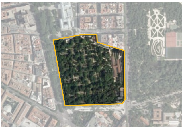
Ámbito del Plan Especial.