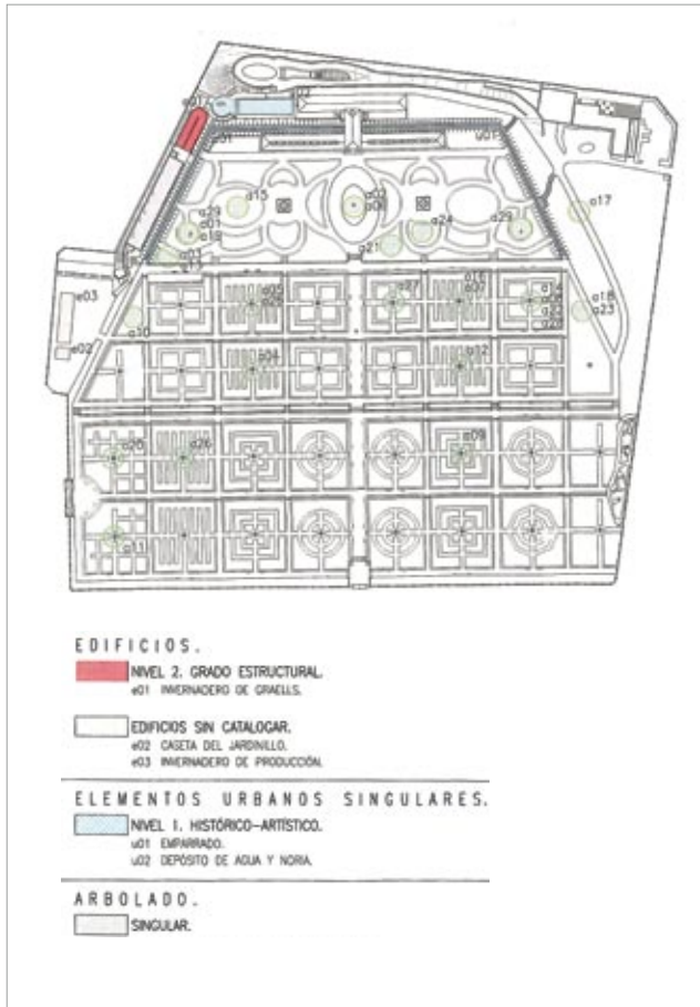
Propuesta de Nuevas Catalogaciones.