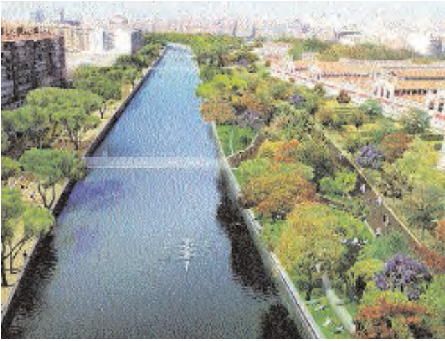
Salón de Pinos y Arganzuela.