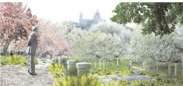
Casa de Campo, Huerta de la Partida.