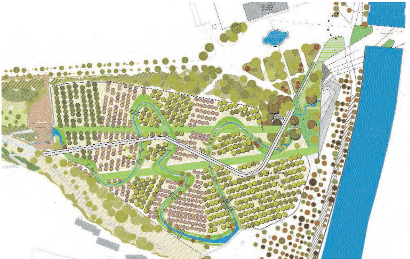
Casa de Campo, planta.