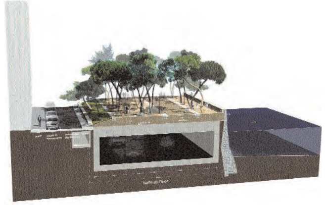
Sección por Salón de Pinos.