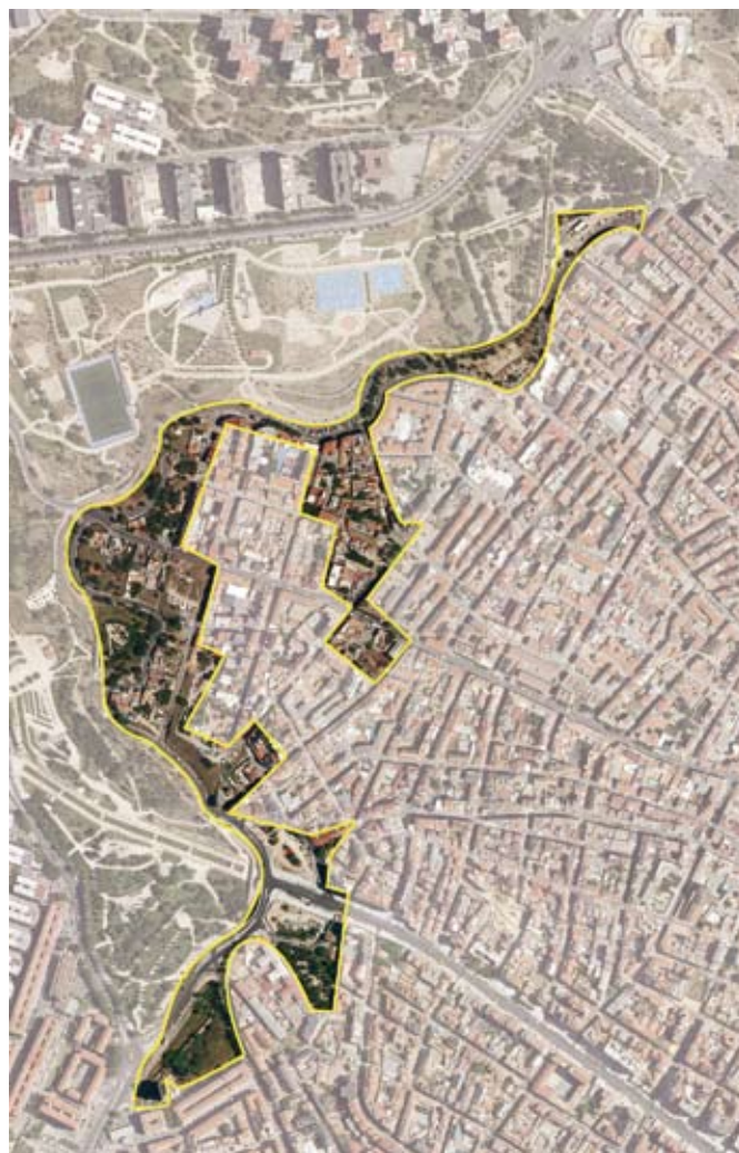
Terrenos correspondientes al ámbito de expropiación APR.06.02 Paseo de la Dirección. Distrito de Tetuán

La Comunidad de Madrid y los municipios comprendidos en su territorio pueden suscribir convenios con personas públicas o privadas, para su colaboración en el mejor y más eficaz desarrollo de la actividad urbanística.