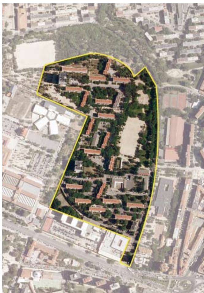
Terrenos correspondientes al ámbito de compensación APR.09.05 Mutualidad de la Policía. Distrito de Moncloa-Aravaca