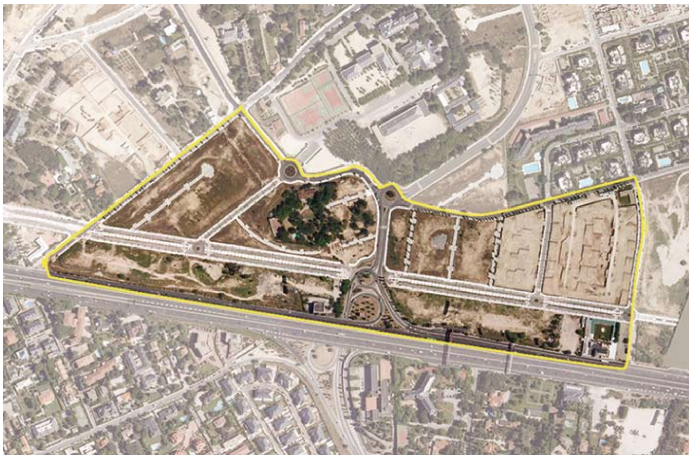
Terrenos correspondientes al ámbito de compensación APE.09.24/UE-4 km 9 de la A-6. Distrito de Moncloa-Aravaca