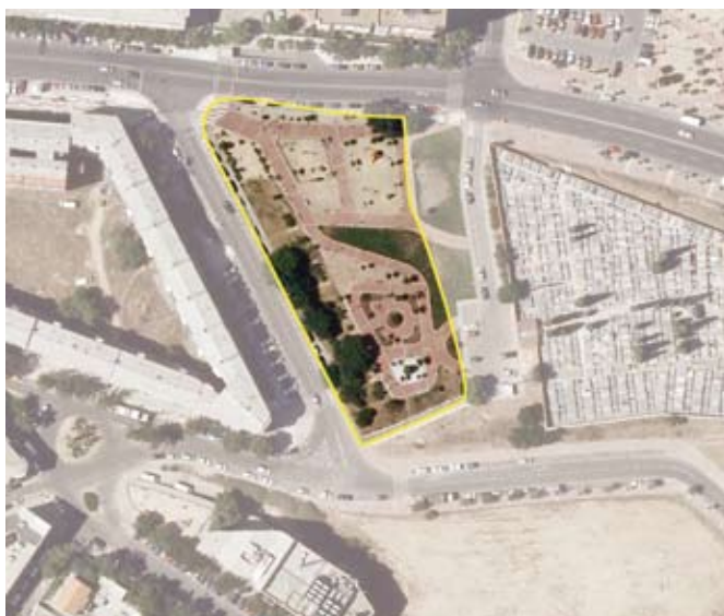
Expropiación en c/ Caños de San Pedro. Distrito de Vicálvaro

Las fechas resaltadas corresponden al período analizado