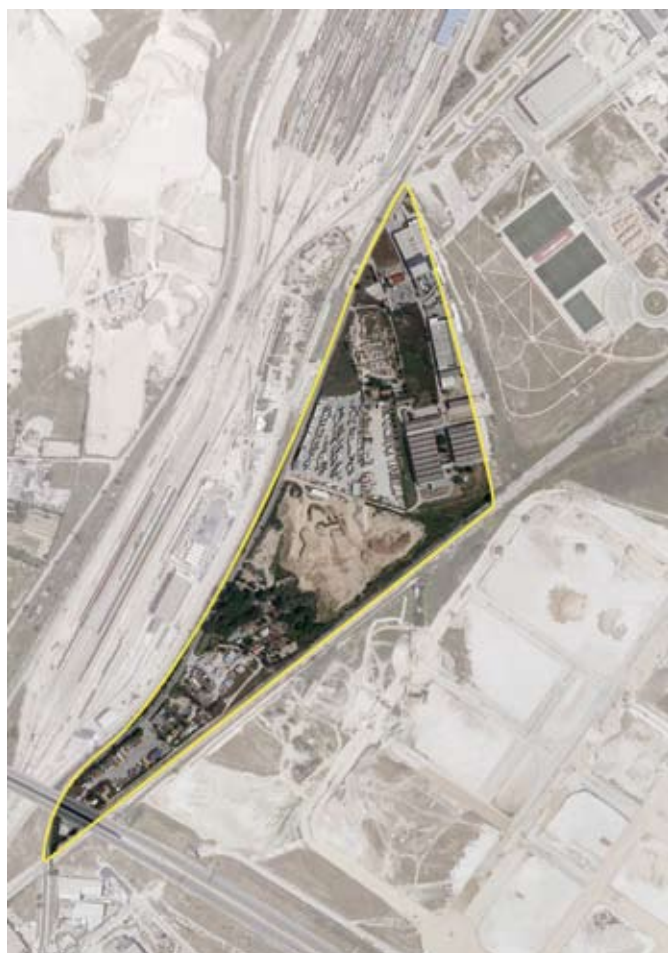
Terrenos correspondientes al ámbito de compensación APR.19.01 Industrial La Marsala. Distrito de Vicálvaro