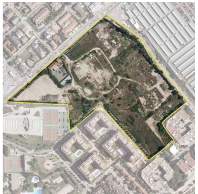
Terrenos correspondientes al ámbito de compensación APR.21.03 Alameda de Osuna. Distrito de Barajas