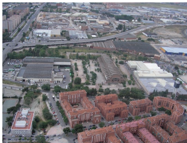
Imagen aérea del ámbito.