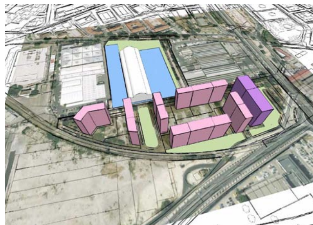
Infografía de la propuesta del Plan Parcial.

El Plan Parcial establece una única etapa y una única unidad de ejecución.