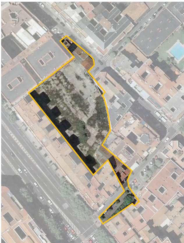
Terrenos correspondientes al ámbito de compensación APR.04.02 Ardemans-Méjico. Distrito de Salamanca.