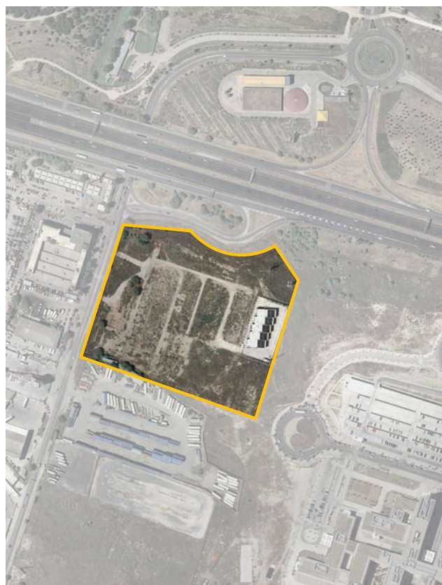
Terrenos correspondientes al ámbito de compensación APR.18.02/M Subestación de Vallecas. Distrito de Villa de Vallecas.