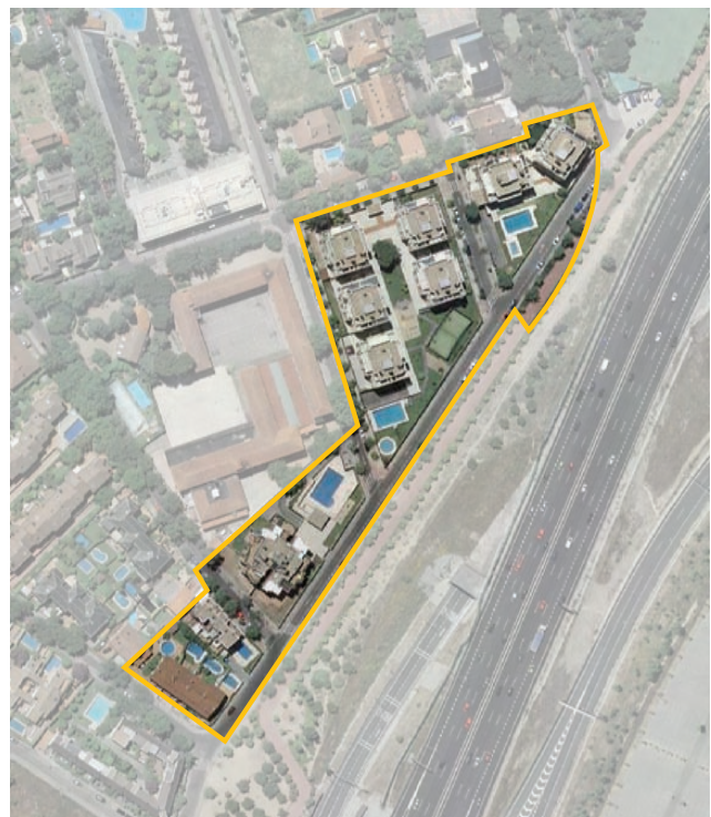
Terrenos correspondientes al ámbito de compensación APE.16.02 c/ Francisco José Arroyo. Distrito de Hortaleza.