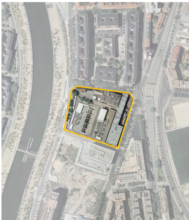
Terrenos correspondientes al ámbito de compensación APE.02.25/M Subestación de Melancólicos. Distrito de Arganzuela.