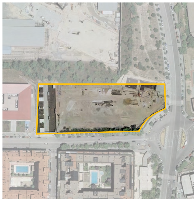
Terrenos correspondientes al ámbito de compensación API.08.04/M Arroyo del Fresno. Distrito de Fuencarral-El Pardo