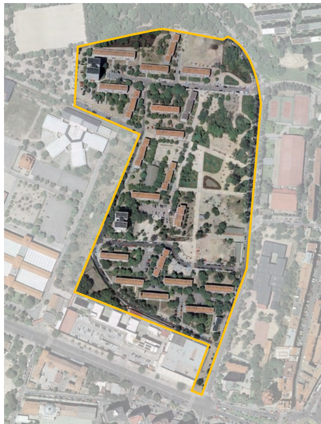
Terrenos correspondientes al ámbito de compensación APR.09.05 Mutualidad de la Policía. Distrito de Moncloa-Aravaca.