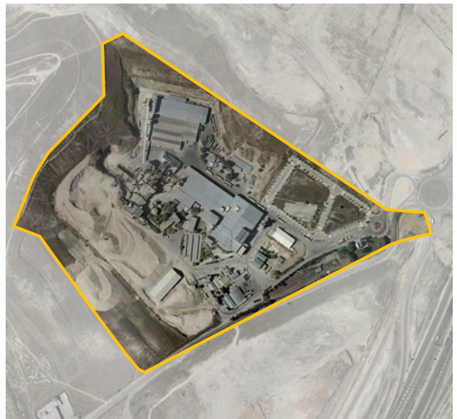
Terrenos correspondientes al ámbito de compensación APR.19.03 Cerro de Almodóvar Sur. Distrito de Vicálvaro.