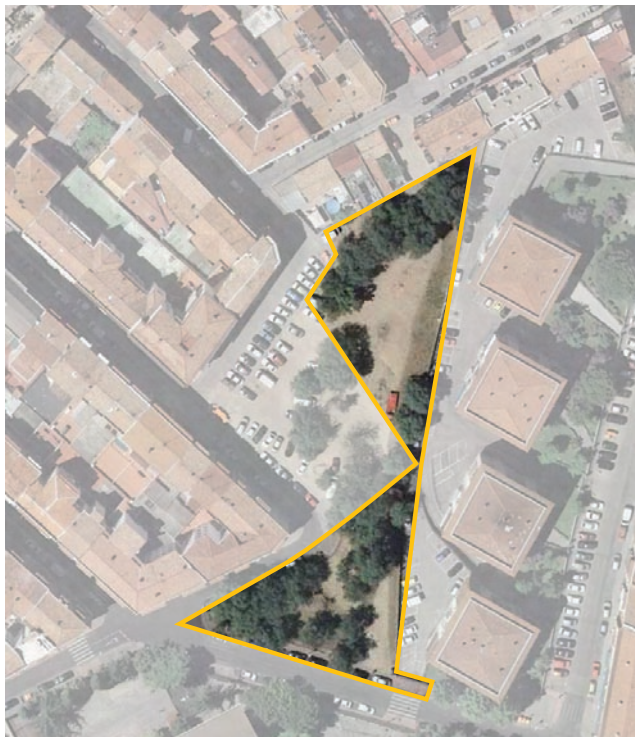
Expropiación en c/ Doctor Zofio c/v a c/ Castelflorite. Distrito de Carabanchel.