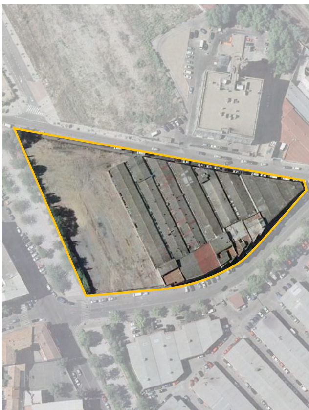
Terrenos correspondientes al ámbito de compensación APR.17.04 Paseo de los Talleres. Distrito de Villaverde.