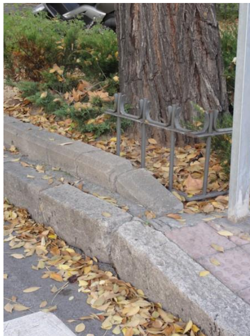
Pavimento levantado por acción de las raíces