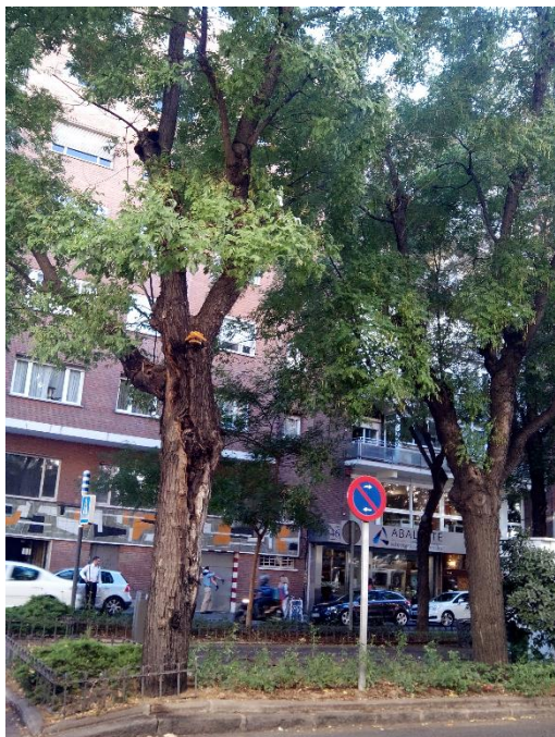
Sófora con numerosas pudriciones severas en tronco y copa