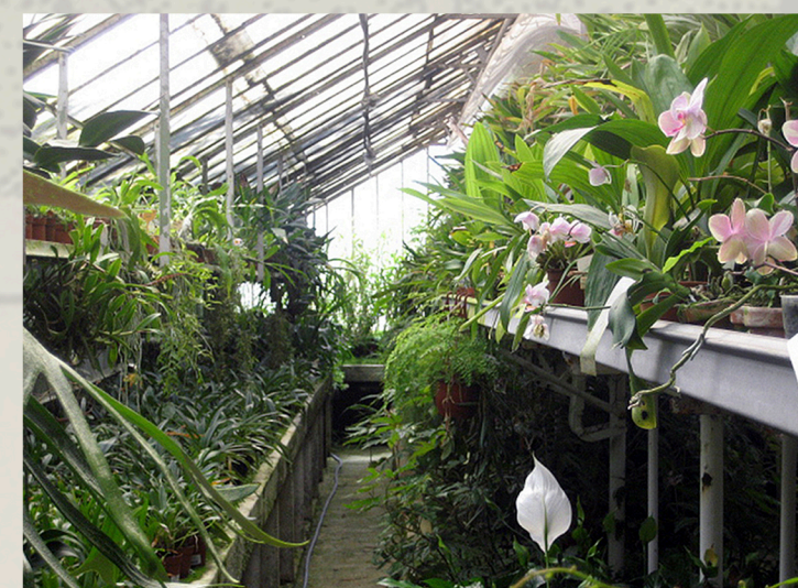
El interior antes de ser desmontada