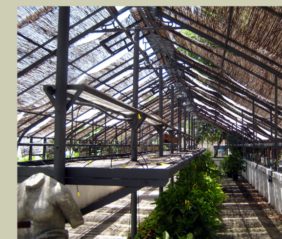
La estufa como umbráculo