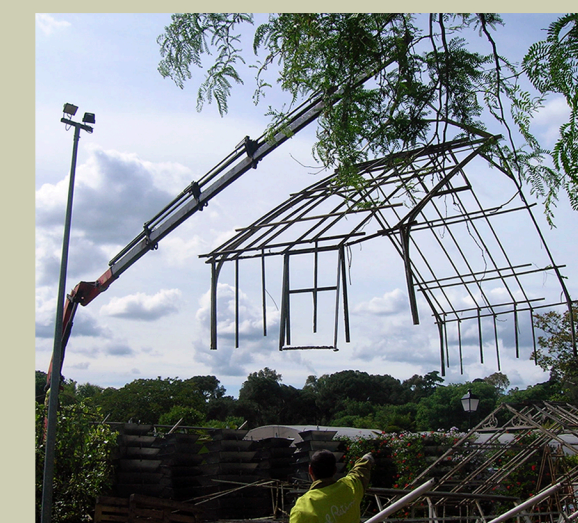
La estufa durante el traslado

Desde 2019 este invernadero alberga exposiciones sobre jardinería y horticultura ornamental, como complemento de la estufa nº 1. Se han instalado con materiales de época y carteles explicativos, junto a una colección ejemplares de plantas crasas, variedades antiguas de Pelargonium y algunas estatuas clásicas procedentes de los antiguos Talleres del Retiro.