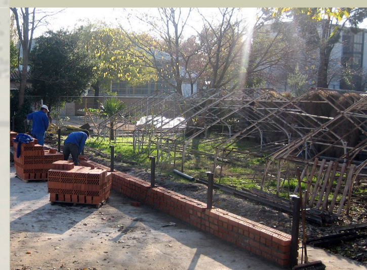
Montaje en el Vivero de Estufas en 2008